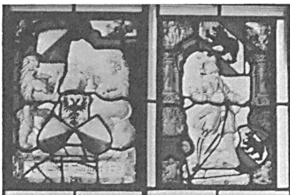
Abb. 5a + b. Standesscheibe Zürich und Bannerträger Bern im Brunnerhaus Glarus.