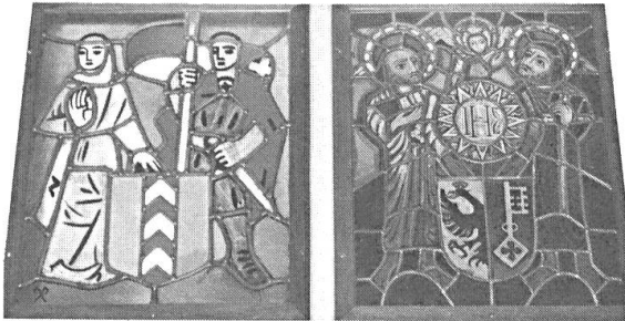
Abb. 1. Geschenkte Standesscheiben schmückten den Landratsaal; hier die Kantone Neuenburg und Genf.