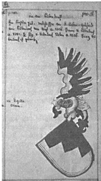
Abb. 4. Wappen von Bubendorf aus dem Wappenbuch des Johann Tschudi.

Ostpreussen und Litauen, Russland, Skandinavien und Brasilien. Allein zwischen 1845 und 1848 wurden von besonderen Auswanderungsvereinen die Emigration von 1405 Personen organisiert. Herrn Müller ist eine mitreissende Einführung in die Geschichte und die Kulturgeschichte seiner Heimat gelungen.