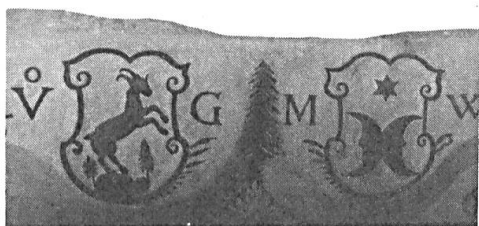
Abb. 9. Türsturz vom Pressihaus in Glarus. Allianz V. Glarner – M. Walser, 1667.

finden sich apokryphe Wappen antiker und frühgeschichtlicher Feldherren, denen als Kuriosum auch ein Bauer beigesellt ist; anstelle eines Schildes trägt er seine Haus- oder Hofmarke auf einem Kornsack zur Schau (Abb. 10). Im Obergeschoss regt eine Schau über Aufstieg, Höhepunkt und Niedergang der Glarner Frühindustrie zum Nachdenken über den tapferen Lebenskampf des kleinen Völkchens unserer glarnerischen Miteidgenossen an.