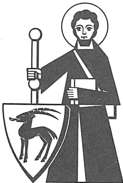
Abb. 7. Bankettkarte von G. Cambin.