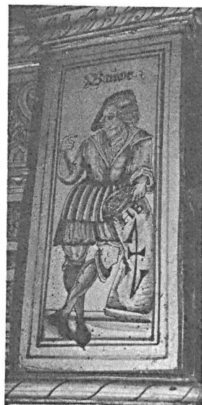
Abb. 10. Bauer mit Hofmarke von einem «Pfauenofen» im Freulerpalast.