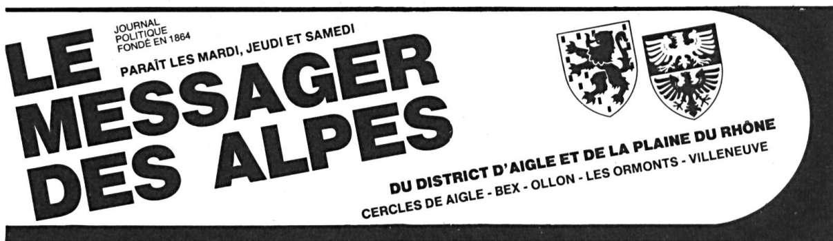
Fig. 4. Messenger des Alpes, 1982.

L'inclusion, dès août 1982, des armoiries du Chablais dans la bande-titre du journal local Le Messenger des Alpes , a été un moment important de la diffusion de ce blason (fig. 4).