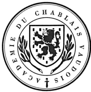
Fig. 2. Académie du Chablais vaudois, 1977.

Lors de la campagne électorale pour l'élection du Conseil national, elles appaurent sur un autocollant vaudois et sur une affiche valaisanne. Cette dernière reprenait le dessin paru la même année (juin 1974) dans le très intéressant livre du chanoine Henri Michelet Le Vieux Chablais des origines à 1569 . Nous ne pouvions en rester là. Dès le mois de mai 1976, une maison de commerce accepte de faire figurer les armes du Chablais à côté de sa raison sociale, puis les incorpore à celle-ci dans ses publications et sa publicité. En 1977, la Revue historique du Mandement de Bex présente à ses lecteurs les armoiries du Chablais tirées du dictionnaire du comte Amédée de Foras : Le Blason et de l' Armorial de John Baud. Le blasonnement proposé s'énonce ainsi : D'argent semé de billettes de sable au lion du même armé et lampassé de gueules brochant sur le tout . L'article est accompagné du dessin de mars 1974.