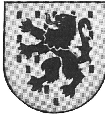
Fig. 3. Au Château d'Aigle.

Le 23 septembre 1977 se fonde à Aigle une « Académie du Chablais vaudois » dont l'emblème (fig. 2) reprend la définition héraldique ci-dessus mais précise : « Lors de l'exécution du dessin des armes, et ceci en contradiction avec les règles de l'héraldique voulant que le nombre de billettes reste indéterminé, nous avons fixé celui-ci à quinze. Il faut rappeler que notre académie veut s'adresser avant tout aux habitants des quinze communes du district d'Aigle. » Les armoiries du Chablais sont apposées en 1979 dans une des salles du Château d'Aigle (fig. 3).