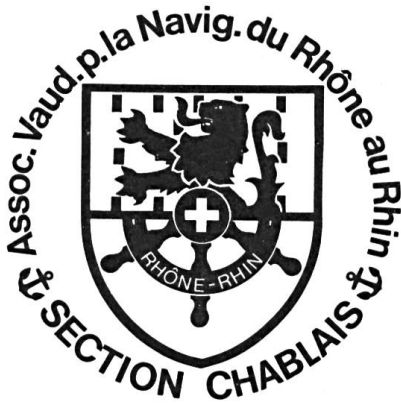
Fig. 5. Sigle de société.