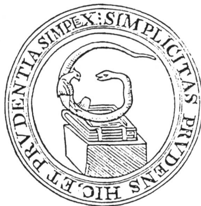
Fig. 3 Emblèmes de Gilbert Cousin.

SIMPLICITAS PRVDENS HIC ET PRVDENTIA SIMPLEX (Fig. 3).