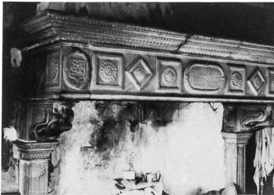
Fig. 1 Cheminée d'Orve.

Au premier étage, auquel on accède par une viorbe, est une remarquable cheminée Renaissance, dont le manteau est soutenu par deux cariatides symbolisant le jour et la nuit: celle de dextre est un buste d'homme avec moustaches et barbiche, surmonté d'un soleil; l'autre, un buste de femme avec seins, surmonté d'un croissant de lune (Fig. 1).