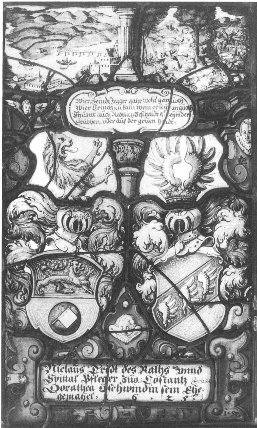
Abb. 2 Allianzring des Niclaus Tridt (Tritt) und der Dorothea Gschwind von Konstanz 1625 mit dem Fuchsmotiv im Oberlicht (vgl. Lit. Nr. 1).