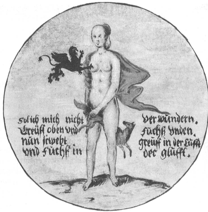
Abb. 3 Zielscheibe des Hans Wilhelm von Streitbergk, 1629. Zeichnung im Coburger Scheibenbuch. Aus A. Braun 4 .

«sol ich mich nicht verwundern greuff oben und Fuchs unden. nun schwebt greuff in der Lufft und Fuchs in der glufft.»