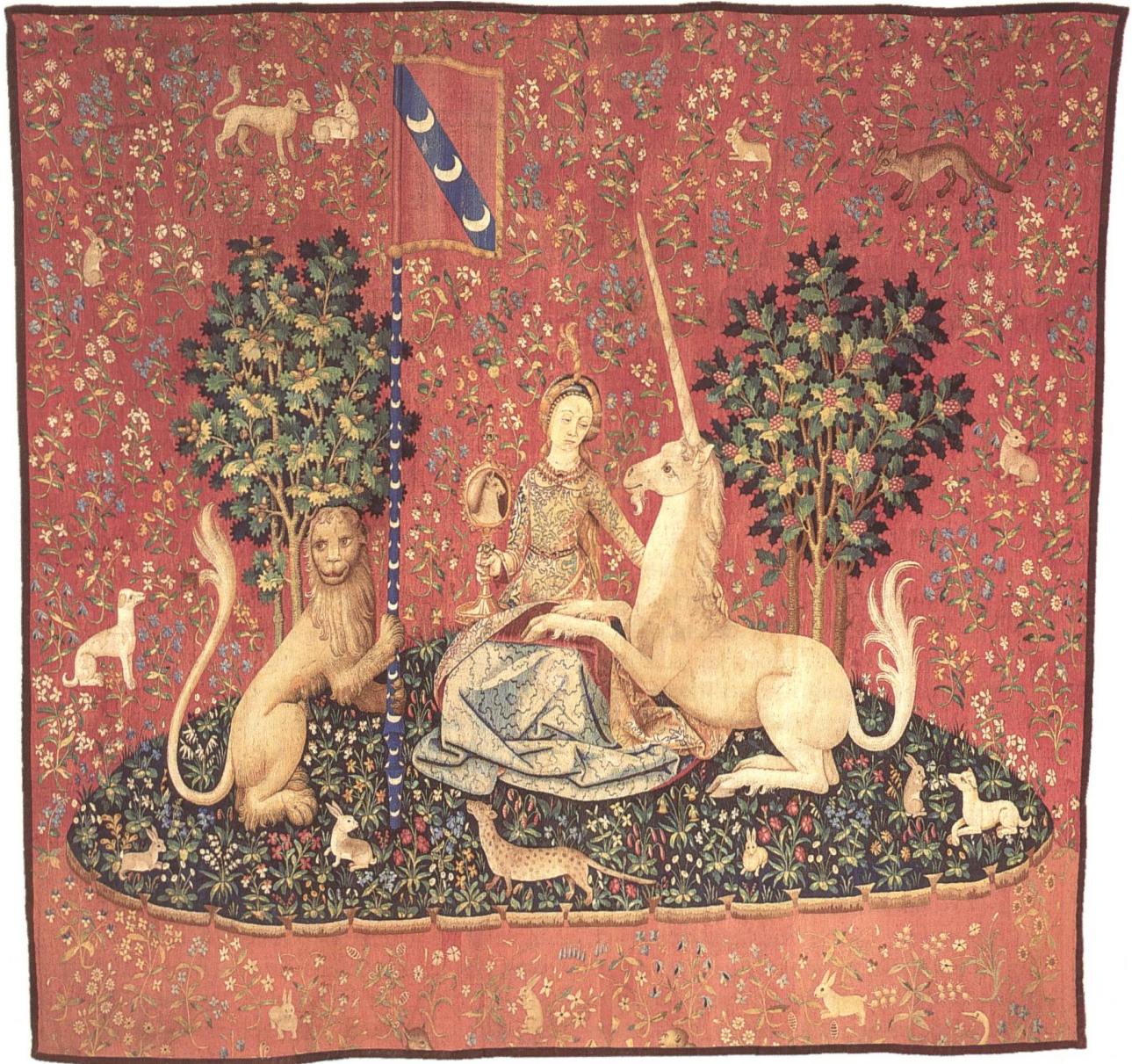
Abb. 1 Das Gesicht / La Vue (86 E 5262)

Kette, den Spiegel! 17 ) Welche Geisteshaltung spricht sich hier aus – an der Wende vom Mittelalter zur Neuzeit?