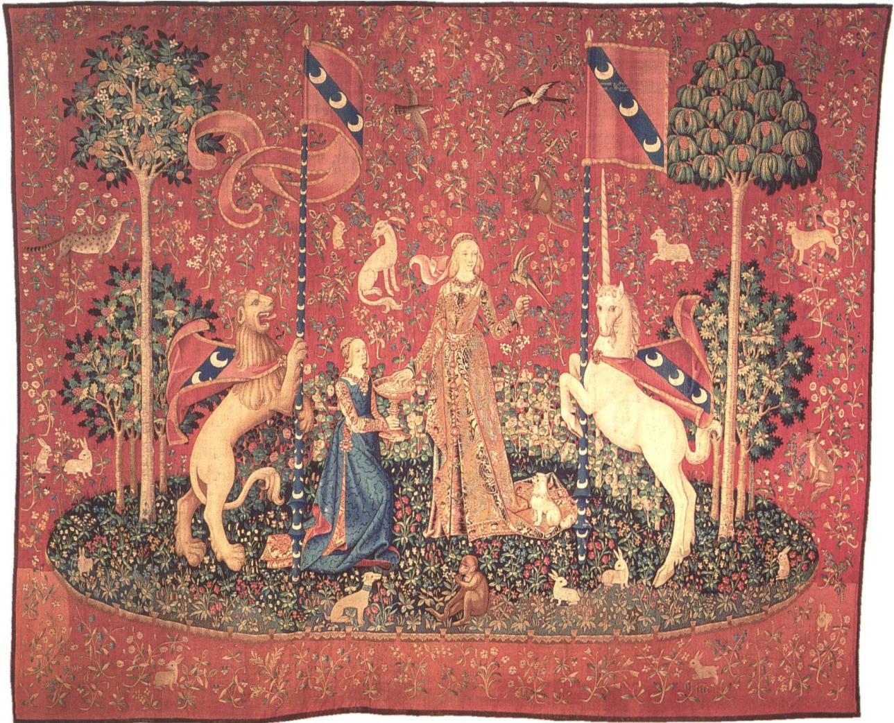
Abb. 5 Der Geschmack / Le Gout (D 86 E 5236)

ner zurück; seine Bedeutung als kriegerisches Kennzeichen ist noch lange bewusst 74 . In den Einhorn-Teppichen wird er zumeist – dreimal – von den Pranken des Löwen gehalten; das Einhorn hält dann das «friedlichere» Banner, das einmal – im GEFÜHL – sogar von der Dame selbst gehalten wird. Neben dem Zelt MON SEVL DESIR bezeugen Gonfanon und Banner die kämpferische und die repräsentative Seite des Mannes, dessen Wappen auf ihnen zu sehen ist 75 .