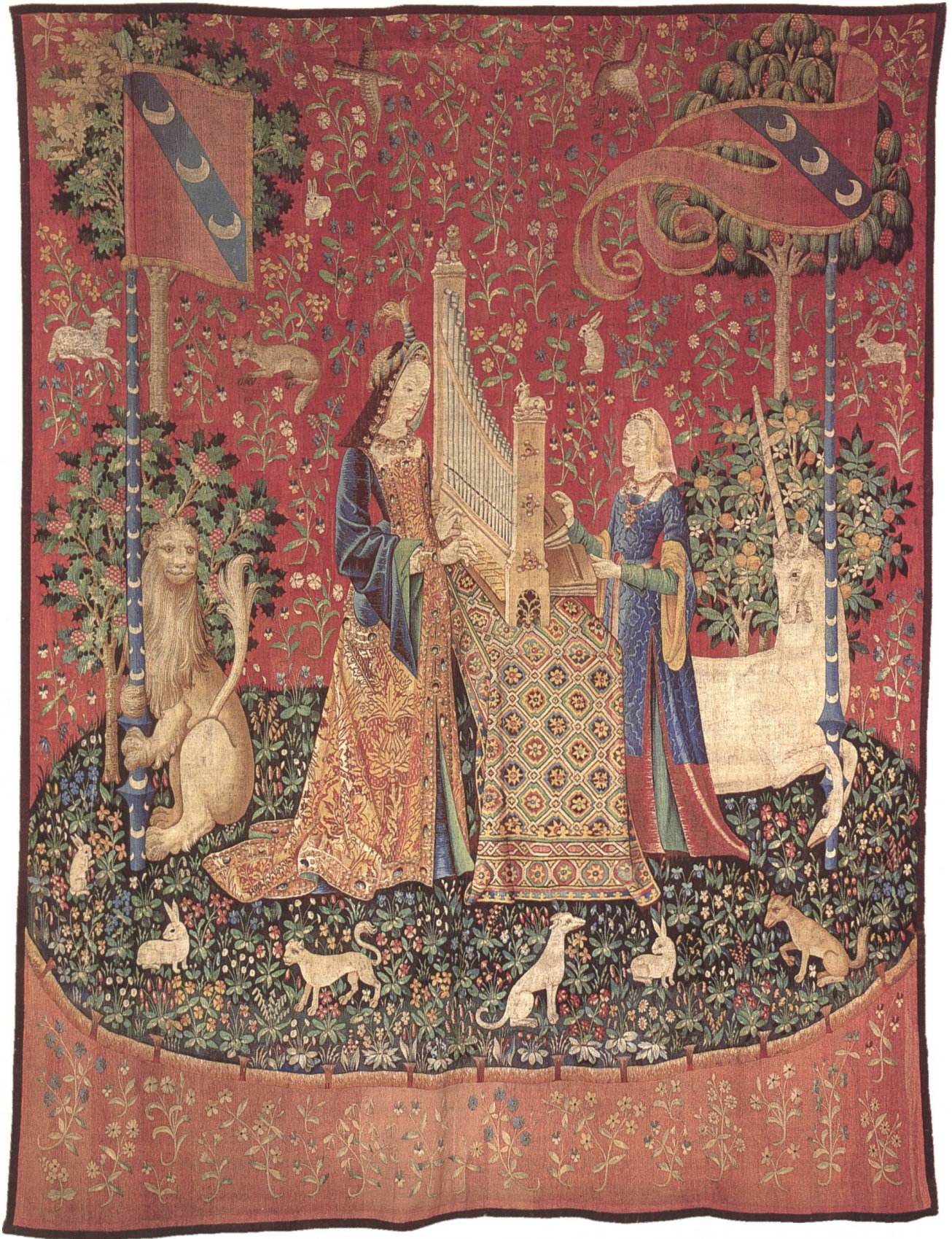
Abb. 3 Der Geruch/L'Odorat (86 E 5247)