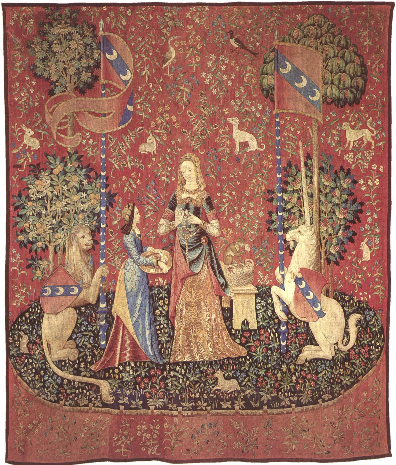
Abb. 2 Das Gehör / L'Ouïe (86 E 5253)