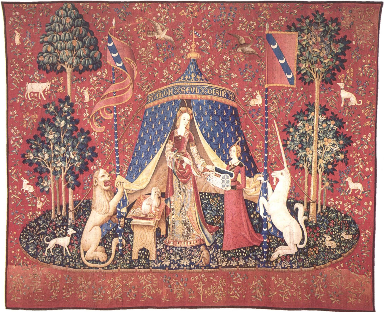
Abb. 6 A · MON SEVL DESIR · I (86 E 5269,)