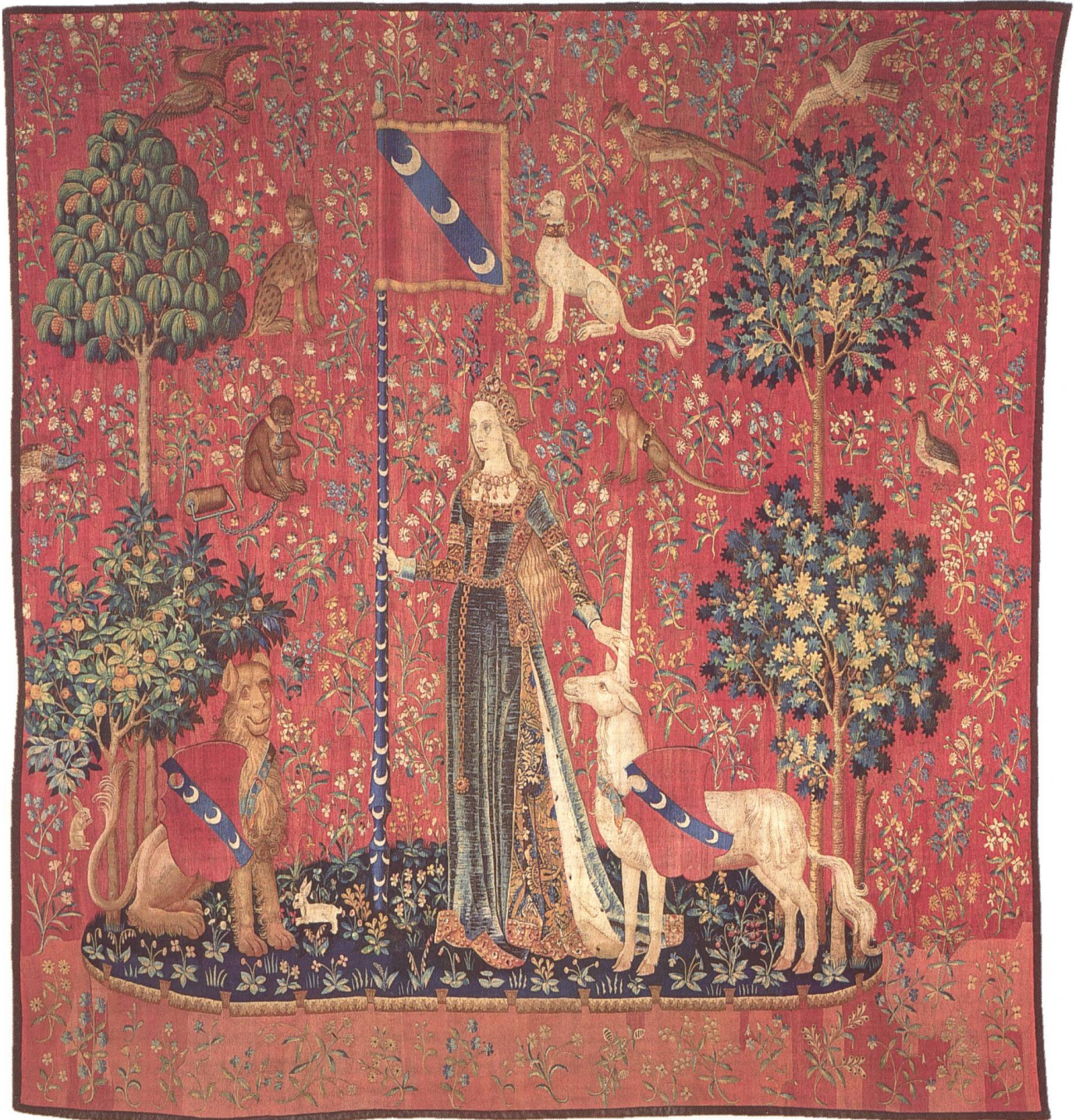
Abb. 4 Das Gefühl/Le Toucher (86 E 5257)