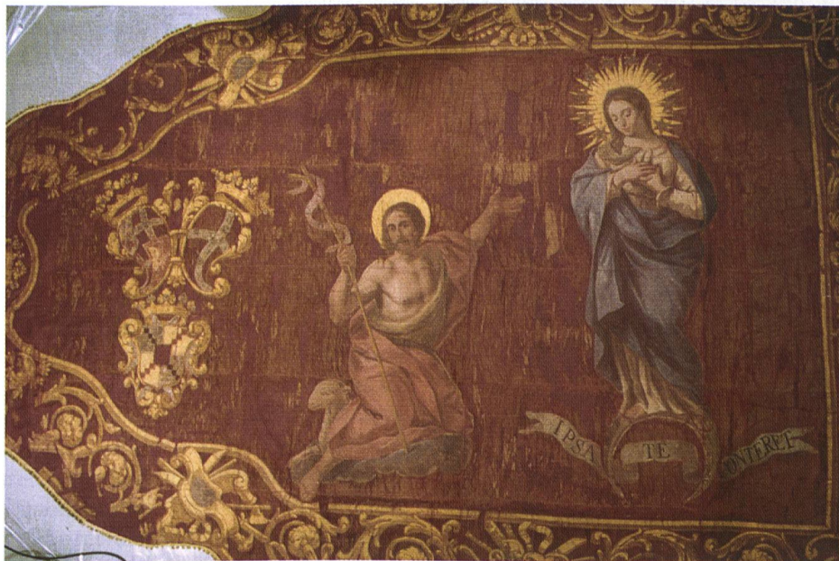
Abb. 1: gesamte Fahne.

Vor einiger Zeit erhielt ich eine Fahne zur Begutachtung und Restaurierung, auf der ein sehr interessanter Wappen-Dreipass zu sehen ist. Es handelt sich hierbei um ein Banner aus schwerem, rotem Seidendamast, der beidseitig identische Malerei hat. Eines dieser Wappen galt es noch zu bestimmen.