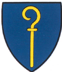
Abb. 1 Wappen der früheren Gemeinde Biel