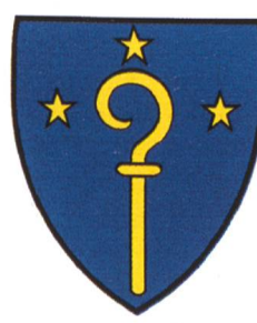
Abb. 3 Wappen der heutigen Gemeinde Grafschaft

Im Oberwallis besteht seit dem 1. Oktober 2000 eine neue Gemeinde unter dem Namen Grafschaft. Wer im Telefonbuch nachschlägt, findet unter der Ortschaft Grafschaft nur gerade einen Anschluss – die Gemeindeverwaltung. Dieser Sachverhalt und auch der Name Grafschaft mögen dem Aussenstehenden rätselhaft erscheinen. Dabei handelt es sich um einen Namen, der im ausgehenden Mittelalter entstand, bei der Bevölkerung ununterbrochen weiterlebte und nun durch die Fusion der Gemeinden Biel, Selkingen und Ritzingen auch offiziell wieder benützt wird.