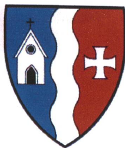
Abb. 3 Wappen der früheren Gemeinde Selkingen