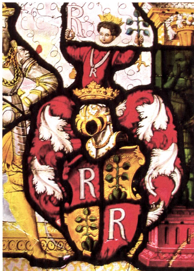
Abb. 4 Ausschnitt aus der Wappenscheibe des Rudolf Reding von 1583.