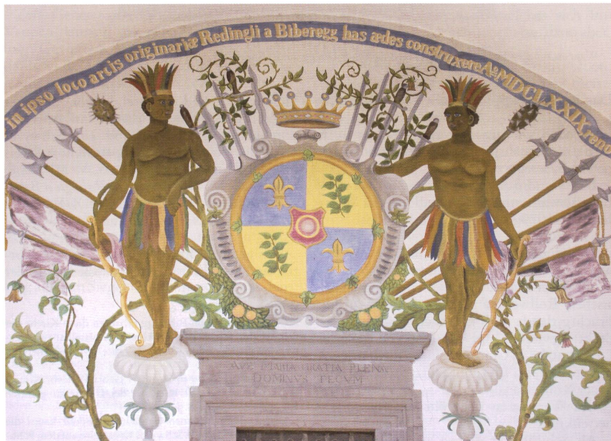
Abb. 9 u. 10 Redingwappen an der Loreto­kapelle in Biberegg.