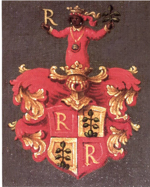
Abb. 3 Wappen des Rudolf Reding auf einem Ölgemälde in der Ital Reding Hofstatt in Schwyz von 1594.