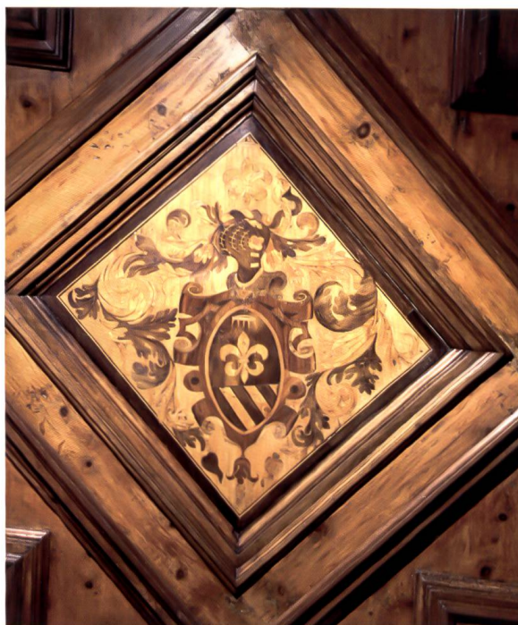
Bild 4: Unbekanntes Wappen an der Holzdecke der stüa Rigamonti. Die heraldischen Embleme weisen auf Veltliner Provenienz hin.

Wappen: «Geteilt, oben französische Lilie, überhöht von einer Krone, unten fünfmal schrägrechts gespalten. – Helmzier: Französische Lilie, überhöht von einer Krone.» Ähnliche Embleme zeigt das Wappen der Mingardini di Sondrio: «Scudo d'azzurro al giglio d'oro con una corona nel capo. – Cimiero: Il giglio d'oro.» Könnte es allenfalls eine Variante der Mingardini sein? Wir wissen es nicht. 29a