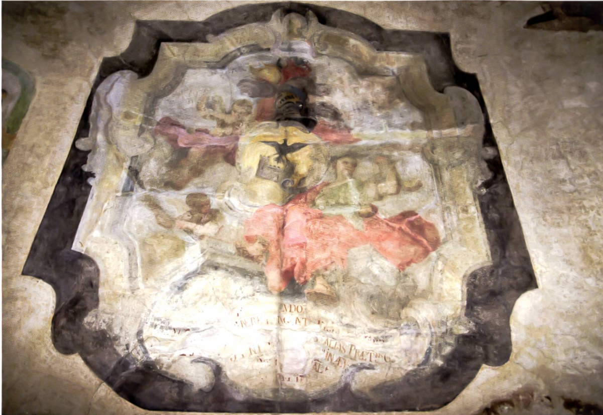
Bild 11: Justitia mit dem Familienwappen Castelli? La Giustizia con l'insegna della famiglia Castelli?