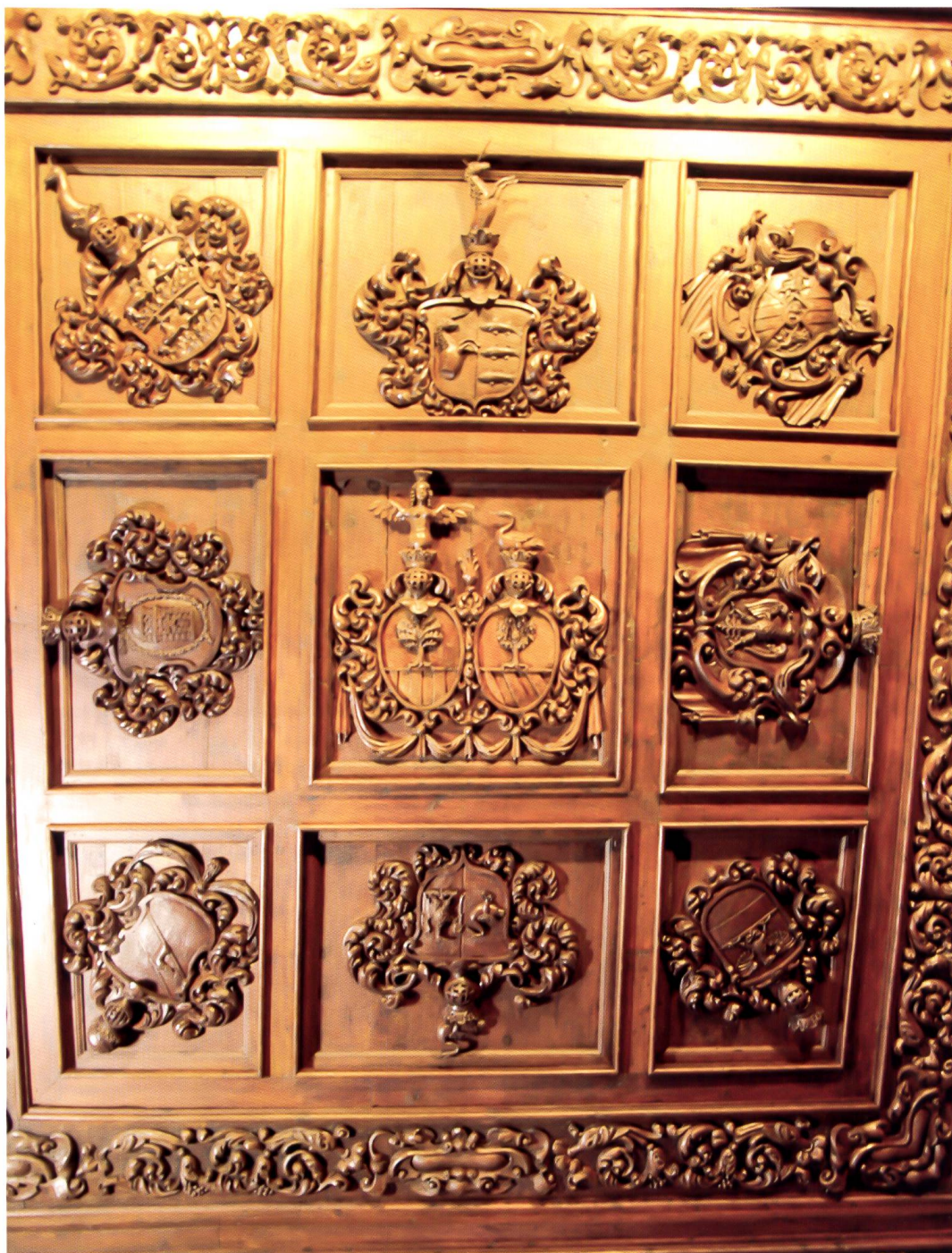
Bild 16: Kassettendecke in der Stüa Salis mit den Allianzwappen Salis-Perari im Zentrum und de Mont-von Schauenstein oben Mitte.

Soffitto a cassettoni nella Stüa Salis con al centro lo stemma d'alleanza Salis-Perari e nel mezzo in alto quello dei de Mont-von Schauenstein.