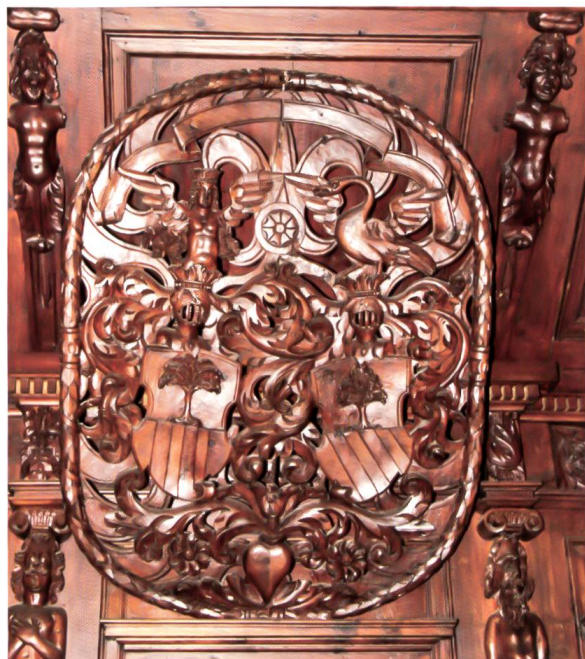
Bild 17: Allianzwappen Salis-Perari über der linken Seitentüre in der Stüa Salis. Stemma d'alleanza Salis-Perari sopra la porta sul lato sinistro della Stüa Salis.