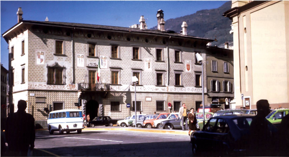
Bild 2: Palazzo Comunale von Sondrio, Aufnahme 1977. Palazzo Comunale di Sondrio, fotografia del 1977.

und der Neubau des Justizpalastes, der westlich am Palazzo angrenzt. Das Projekt stammte von Ing. Antonio Giussani, der die Architektur und innere Ausstattung vor und nach dem Umbau eingehend beschrieb. Wie bereits erwähnt, wurde das Gebäude aufgestockt und die Fassaden neu gestaltet. Dabei wurden ornamentale Motive der lokalen Renaissancearchitektur verwendet. In der obersten Reihe unter dem Dach wurden die Wappen der wichtigsten Provinzgemeinden dargestellt. Längs der Gesimse zwischen dem ersten und zweiten Geschoss wurden grossformatige Wappen aus der Zeit der Visconti und Sforza gemalt. Alle Dekorationen wurden durch den Maler Giovanni Vainini ausgeführt. 25