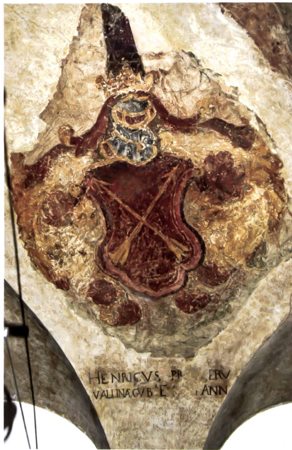
Bild 6: Wappen des Landeshauptmanns Heinrich Sprecher v. Bernegg. Stemma del governatore Heinrich Sprecher v. Bernegg.

Sprecher v. Bernegg stammte aus Luzein und war 1655/57 Landeshauptmann in Sondrio.