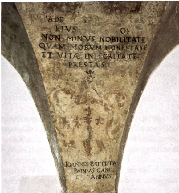
Bild 9: Wappen des Cancelliere Giovanni Battista Paini. Stemma del cancelliere Giovanni Battista Paini.