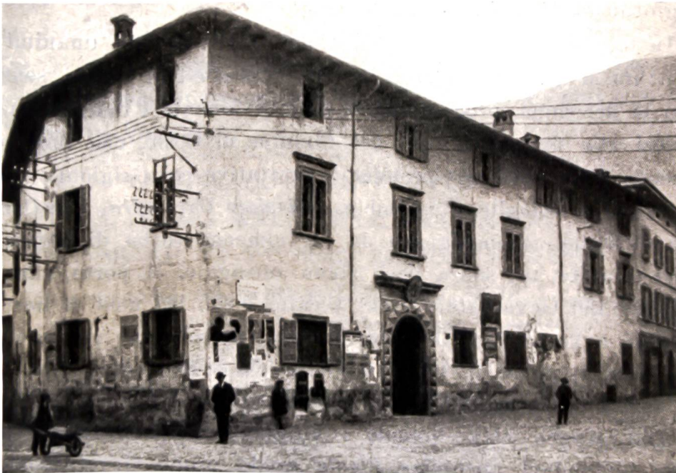
Bild 1: Aufnahme des Pretorios vor der Restauration von 1915/17. Es ist das älteste uns bekannte Bild und zeigt das Pretorio in einem desolaten Zustand. 23 Il Pretorio prima del restauro del 1915/17. La foto, la più antica a noi giunta, mostra il Pretorio in uno stato di decadenza e di degrado.

Truppen der Drei Bünde unter der Führung von Conradin Planta bekanntlich das Veltlin und die beiden Grafschaften Chiavenna und Bormio ein. Drei Jahre später nahm Rudolf v. Marmels, der als Erster vom Consiglio della Valle als Landeshauptmann anerkannt wurde, Sitz im Schloss Masegra oberhalb von Sondrio. Demnach könnte dies möglicherweise der erste offizielle Amtssitz des Landeshauptmanns gewesen sein, denn der Palazzo an der Piazza Campello stammt erst aus dem Jahre 1552. 22