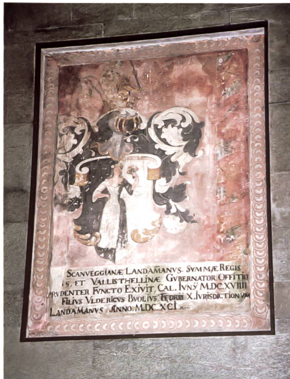
Bild 3: Wappen und lateinische Inschrift des Landeshauptmanns Fluri Buol.

Stemma con iscrizione latina del governatore Fluri Buol.