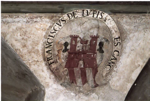
Bild 5a: Wappen des Cancelliere Francesco de Lupi. Stemma del cancelliere Francesco de Lupi.

Das Wappen dieses Kanzlers befindet sich unter der Inschrift für Peter Tonaschi. Allenfalls war de Lupi dessen Schreiber.