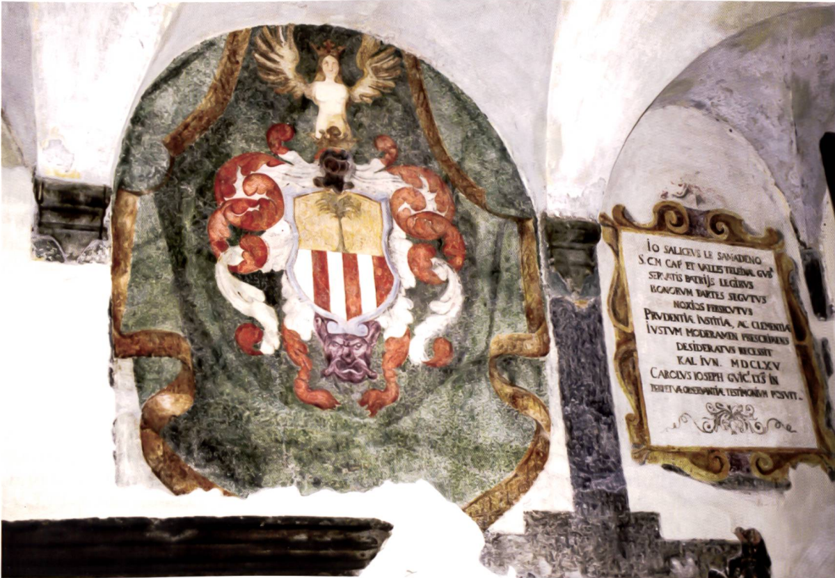
Bild 12: Wappen und lateinische Inschrift des Landeshauptmanns Johann v. Salis. Stemma con iscrizione latina del governatore Johann v. Salis.

Johann von Salis (1609–1680) stammte aus Samedan und war 1663/65 Landeshauptmann in Sondrio.