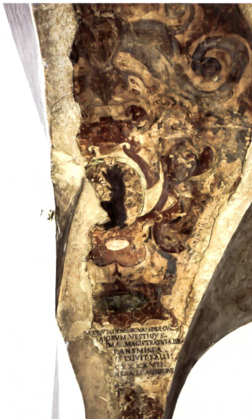
Bild 7: Wappen des Landeshauptmanns Johann Planta v. Wildenberg. Stemma del governatore Johann Planta v. Wildenberg.

Planta stammte aus Zernez und war 1645/47 Landeshauptmann in Sondrio.