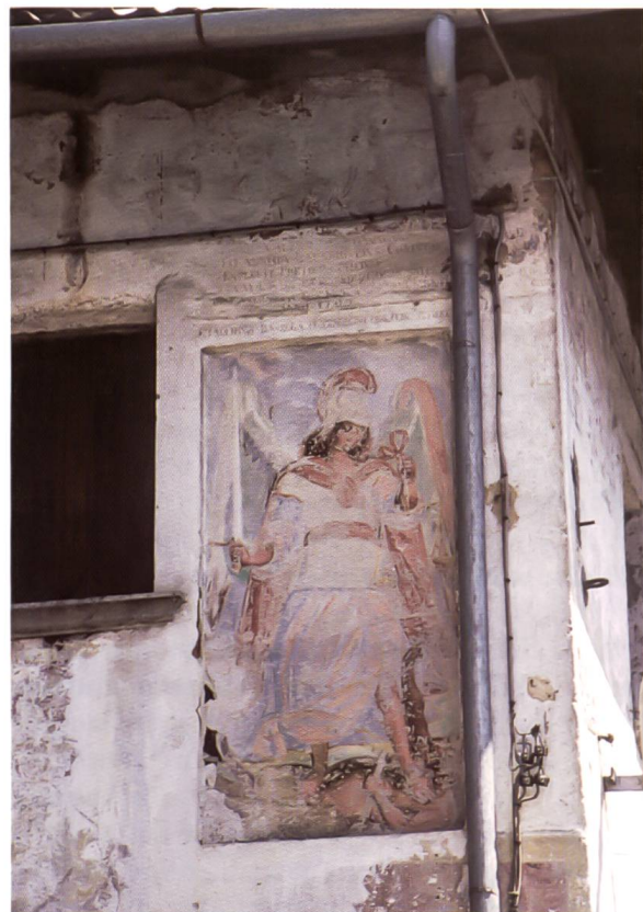
Bild 115: Erzengel Michael als Justitia mit Schwert und Waage. L'arcangelo Michele giustiziere con spada e bilancia.