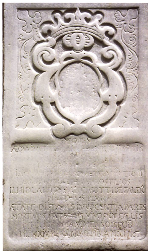
Bild 123: Grabmal für zwei Söhne des Podestà Johann Luzi Casutt. Die Grabplatte aus weissem Marmor zeigt oben das total verwitterte Wappen Casutt und unten die Grabschrift, die teilweise noch erkennbar ist.

Johann Luzi Casutt stammte aus Falera und war 1715/17 Podestà von Piuro. Im Oktober bzw. November des Jahres 1716 starben die Söhne des Podestà.