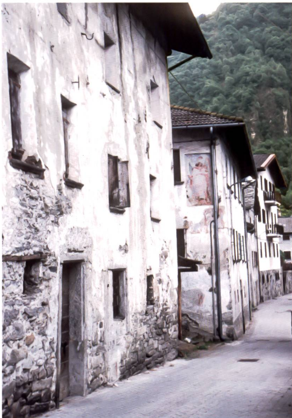
Bild 114: Das Pretorio von Santa Croce mit dem Bild des Erzengels Michael an der Westfassade. Il Pretorio di Santa Croce con l'immagine dell'arcangelo Michele sulla facciata ovest.

Das neue Pretorio befindet sich an der Strada Vecchia in Santa Croce, unmittelbar neben der Chiesa Rotonda. Heute wird es Ca de la giüstizia genannt. Das Gebäude wurde 1639–42 erstellt, also unmittelbar nach der Wiedererlangung der Herrschaft über die Untertanenlande durch das Mailänder Kapitulat von 1639. 172