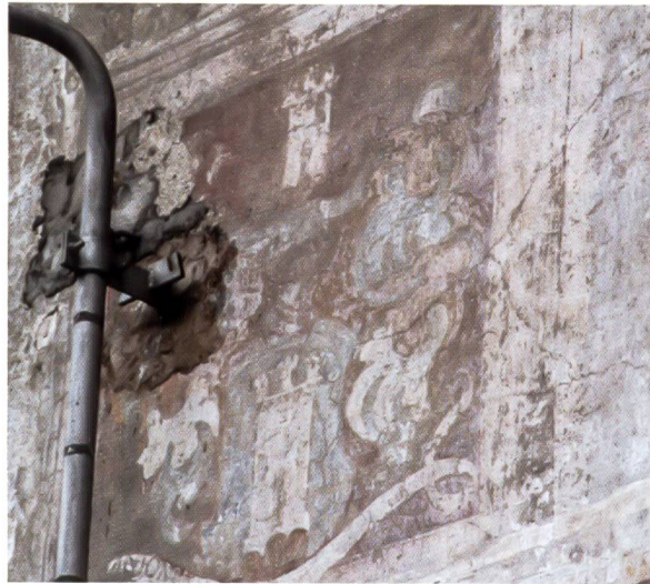
Bild 116: Wappen des Johann Anton Burgauer. Stemma di Johann Anton Burgauer.

Burgauer stammte aus Untervaz und war 1653/55 Podestà von Piuro.