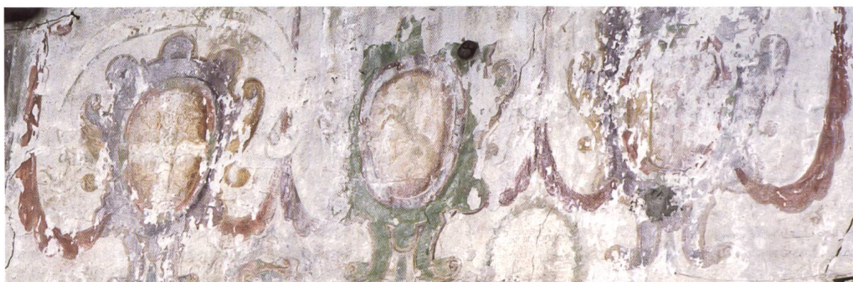
Bild 118: Wappen der Drei Bünde: Oberer Bund, Gotteshausbund, Zehngerichten-Bund. Stemmi delle Tre Leghe: Lega Superiore, Lega Caddea e Lega delle Dieci Giurisdizioni.