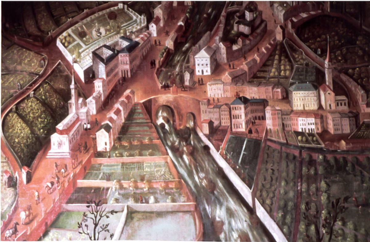
Bild 113: Das alte Piuro nach einem Ölbild aus dem 17. Jahrhundert. Der Bildausschnitt zeigt prachtvolle Gebäude wie die Chiesa Santa Maria und das Schloss Vertemate a Franchi. Vor dem Untergang zählte Piuro an die tausend Einwohner. L'antica Piuro in un dipinto ad olio del XVII secolo. Vi si individuano diversi nobili edifici tra cui la chiesa di Santa Maria e il Palazzo Vertemate a Franchi. Al tempo della frana, Piuro contava circa mille abitanti.