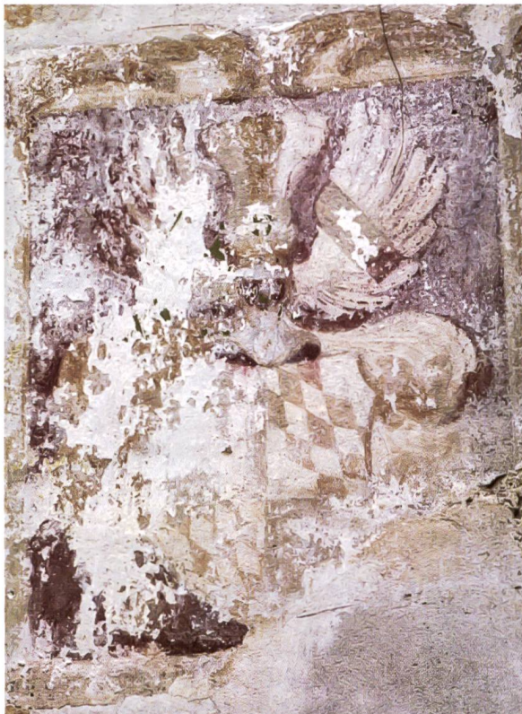
Bild 120: Wappen des Paul Scarpatetti. Stemma di Paul Scarpatetti.

Dieses Wappen befindet sich in der dritten Reihe, unmittelbar unter dem Cadonau-Wappen. Es ist stark verwittert, kann aber eindeutig als Scarpatetti-Wappen identifiziert werden.