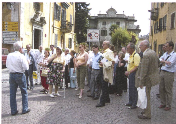
Fig. 7: Die deutschsprachige Gruppe, in der Hintergrundmitte der Palazzo Salis.