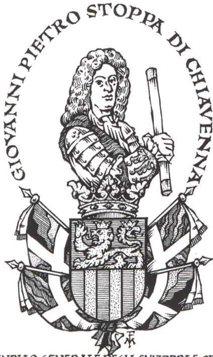
COLONNELLO GENERALE DEGLI SVIZZERI E GRIGIONI COLONEL-GÉNÉRAL DES SUISSES ET GRISONS GENERALOBERST DER SCHWEIZER UND BÜNDNER (1688 - 1698)