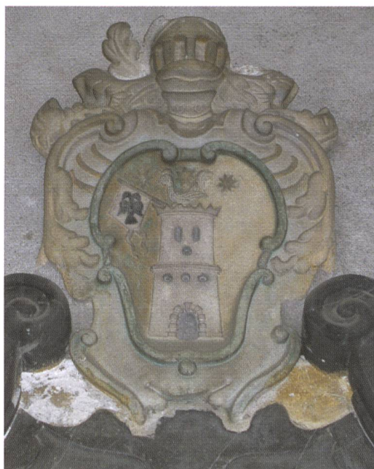
Fig. 9: Wappen der Chiavener Familie Torricella, 18. Jh.