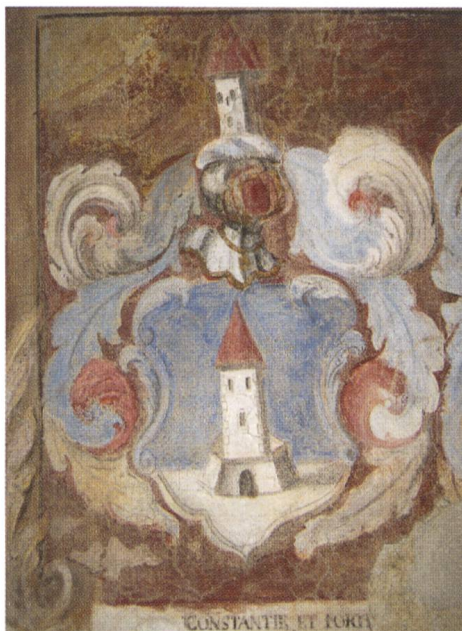
Fig. 6: Wappenfresko des Johann Gaudenz Schorsch im Pretorio, frühes 18. Jh.