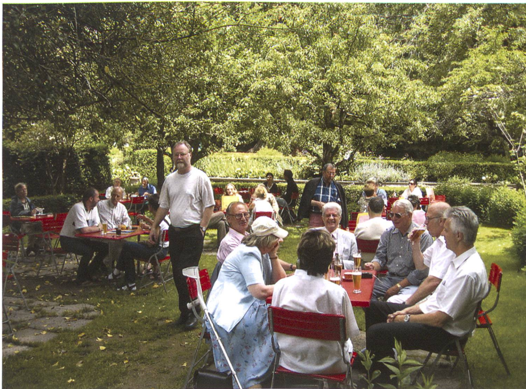
Fig. 16: Die Heraldische Gesellschaft im Garten des Palazzo Salis.