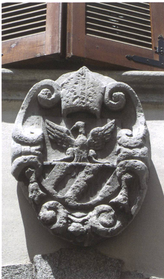
Fig. 4: In Stein gemeisseltes Wappen eines einheimischen Amtsmannes.