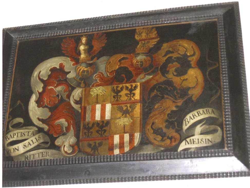
Fig. 15: Allianzwappen Salis-Meisin im Palazzo Salis in Soglio.