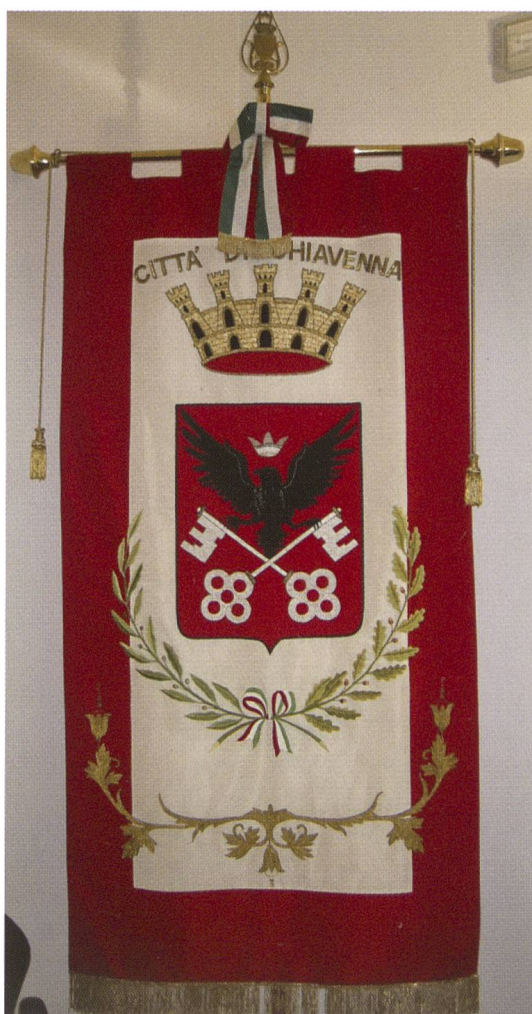
Fig. 10: Gonfalon der Stadt Chiavenna im Rathaus.