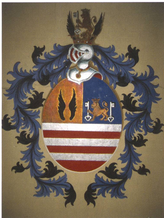
Fig. 2: Familienwappen Pestalozzi, im 19. Jh. restauriert.