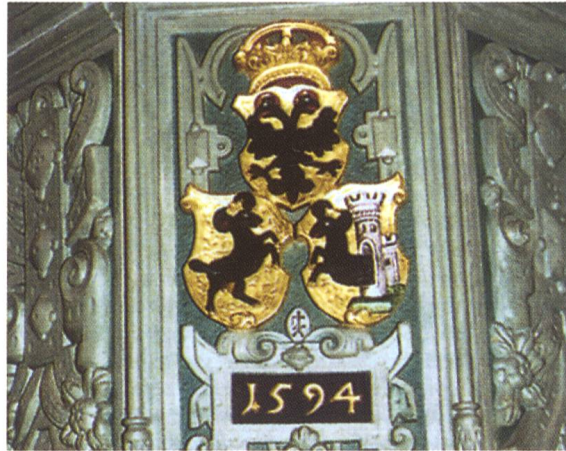
Bild: Wappendreipass auf der Kanzel von 1594 (aus dem besprochenen Buche)

ARCHIVIO DI STATO DI FIRENZE. MINISTERO PER I BENI E LE ATTIVITÀ CULTURALI. Ceramelli Papiani. Blasoni della famiglie toscane ( http://www.archiviodistato.firenze.it/ceramellipapiani )