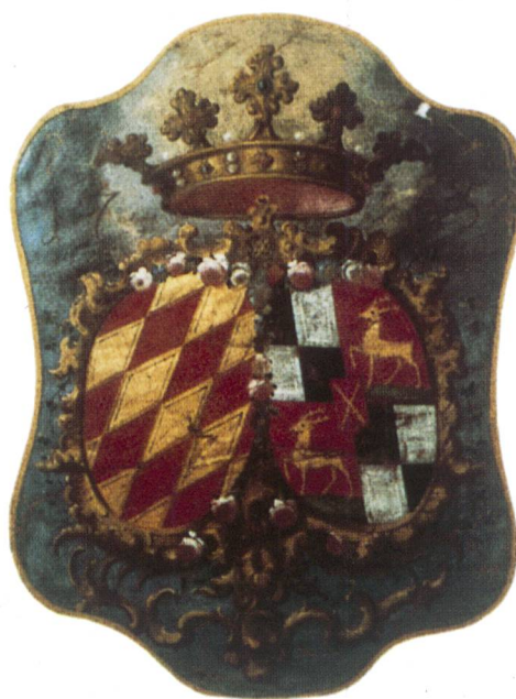
Wappenscheibe und -fragment aus dem besprochenen Werk.