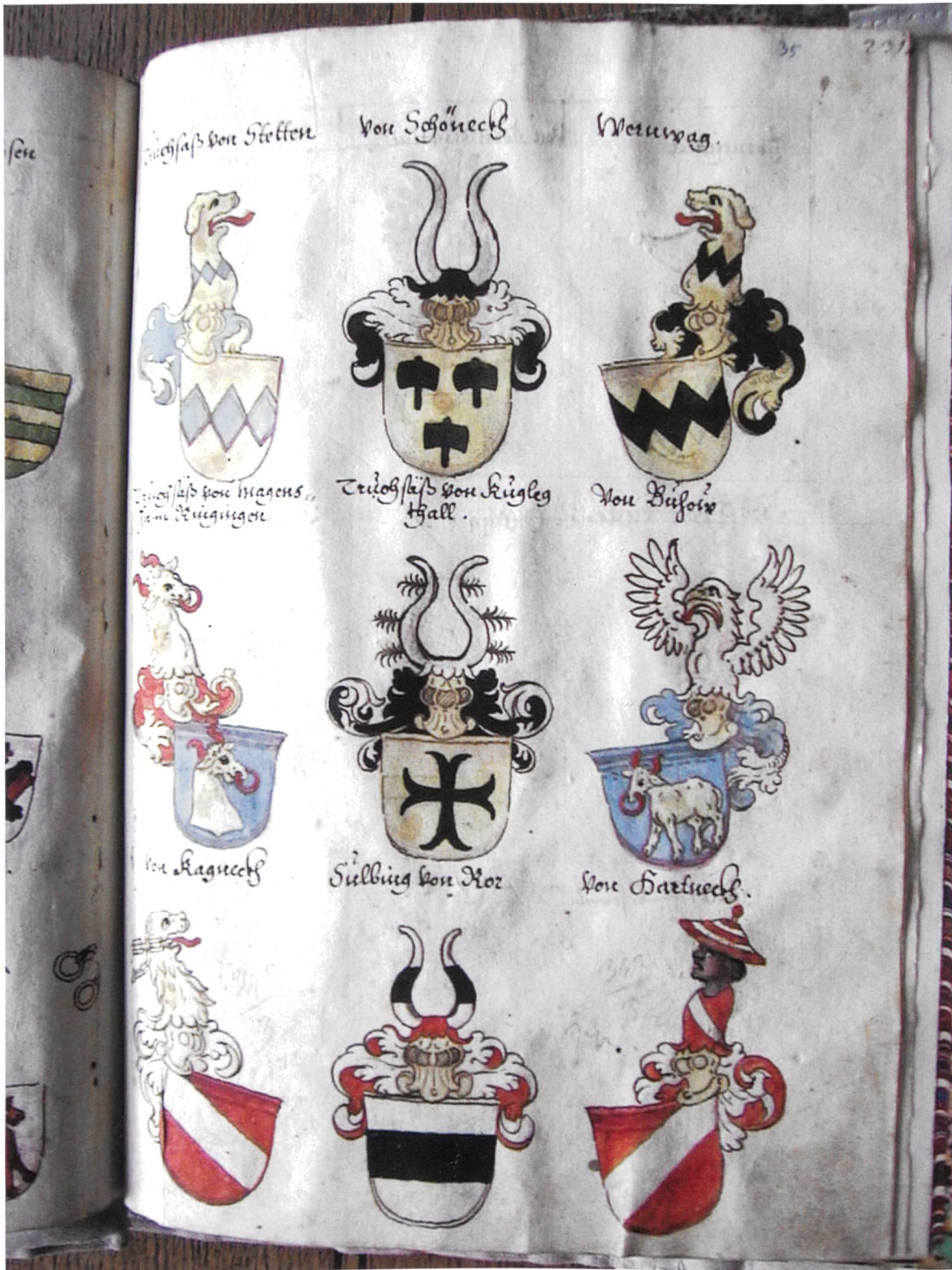
p. 231 – n° 595–603