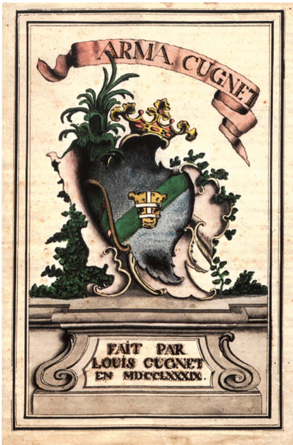
Fig. 1. Louis Cugnet I ou II: armoiries Cugnet, aquarelle, 1789.