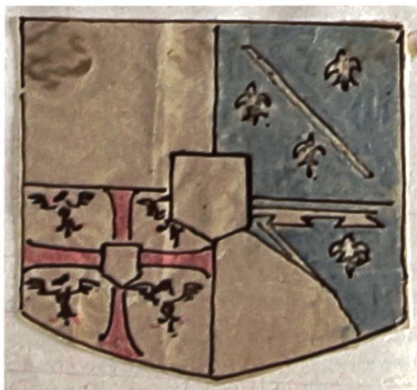
Abb. 2a. Zustand des Wappenschildes im 19. Jh. Zeichnung im Inventarbuch des MAH von 1920.

Staddächern an einer langen Stange aufgehängten Hauptes seines Anführers die Flucht ergreift.