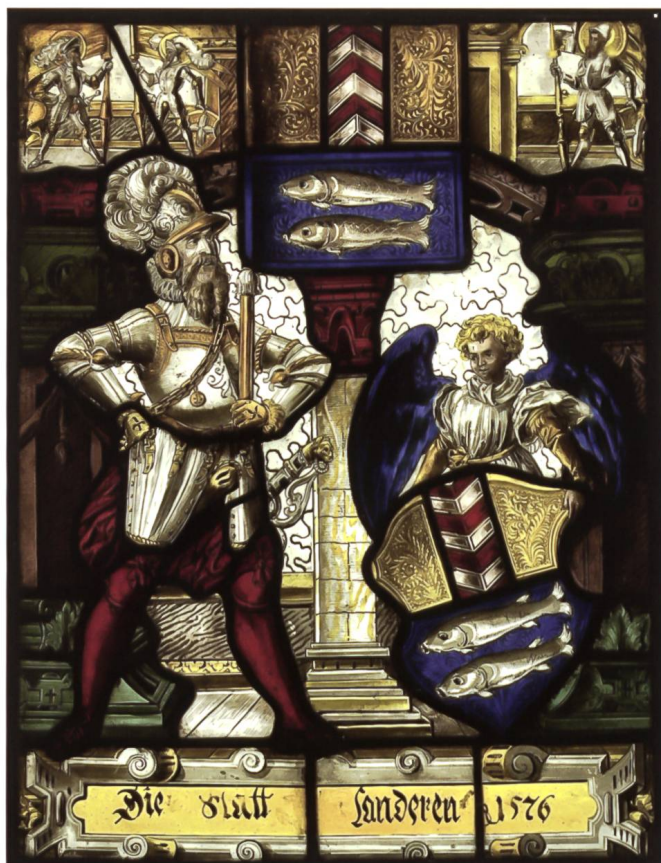
Abb. 5. MAH, Bannerträgerscheibe Le Landeron, um 1880/90.