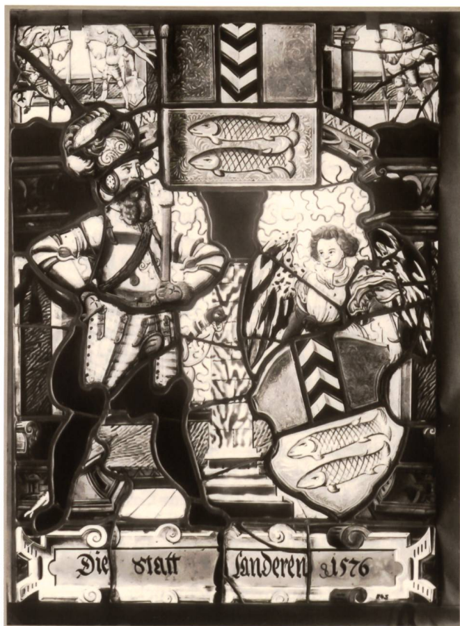
Abb. 5a. Bannerträgerscheibe Le Landeron, 1576. Schweizerisches Nationalmuseum Zürich, Foto-Neg. 545 (DIG-31348).

in den beiden Oberlichtfeldern eine befestigte Stadt unter Kanonenbeschuss dargestellt.