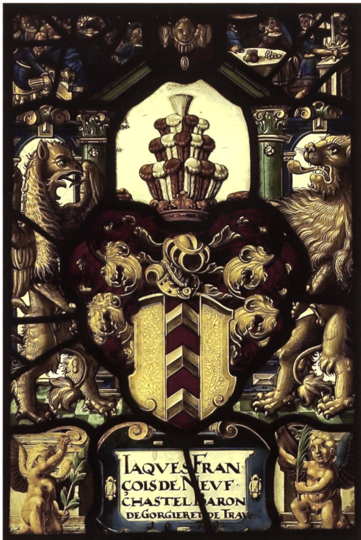
Abb. 3. MAH, Wappenscheibe Jacques François de Neuchâtel, 1670.

wurde. 5 Die Inschrift nennt als Stifter Henri II d'Orléans-Longueville (27. 4. 1595–11. 5. 1663), den Sohn des Neuenburger Grafen Henri I d'Orléans-Longueville und der Catherine de Gonzague. Nach dem Tod seines Vaters wurde ihm noch in seinem Geburtsjahr die Grafschaft Neuenburg übertragen. Vor seiner Volljährigkeit wurde die Regentschaft von 1595 bis 1601 durch seine Grossmutter Marie de Bourbon und danach bis 1617 durch seine Mutter ausgeübt. Die Stiftung des Glasgemäldes ins Neuenburger Schützenhaus erfolgte demnach noch zur Regierungszeit seiner Mutter Catherine de Gonzague. Dadurch erklärt sich das im Schild vorhandene Gonzaga-Wappen. Henri d'Orléans-Longueville selbst kam erstmals 1618 für ein Jahr nach Neuenburg. Danach besuchte er die Stadt