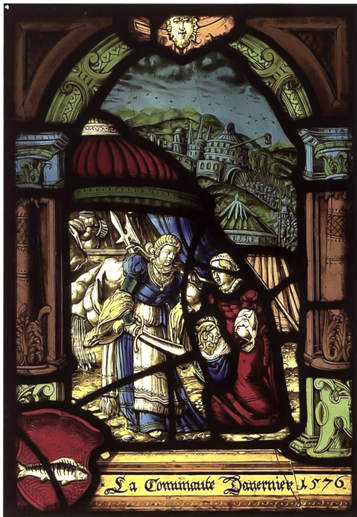
Abb. 1. MAH, Bildscheibe Auvernier, 1576.