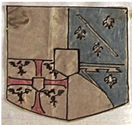
Abb. 2a. Zustand des Wappenschildes im 19. Jh. Zeichnung im Inventarbuch des MAH von 1920.

Staddächern an einer langen Stange aufgehängten Hauptes seines Anführers die Flucht ergreift.