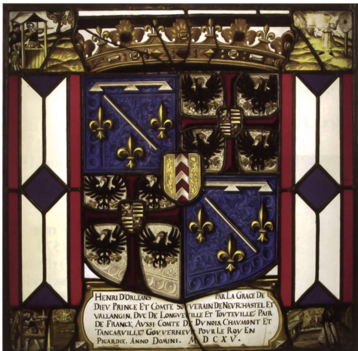
Abb. 2. MAH, Wappenscheibe Henri II d'Orléans-Longueville, 1615.