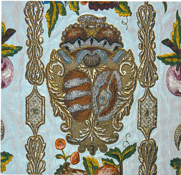
Bild 9: Gesticktes Allianzwappen des Franz Thomas von Schauenstein in der Pfarrkirche. von Domat/Ems.