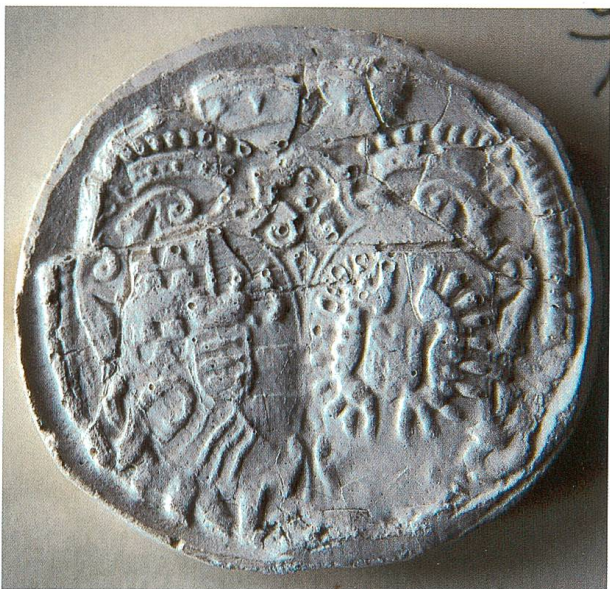
Bild 10: Gipssiegel im StAGR des Grafen Franz Thomas von Schauenstein, Herr zu Haldenstein, Tamins und Trins (30 x 27 mm).