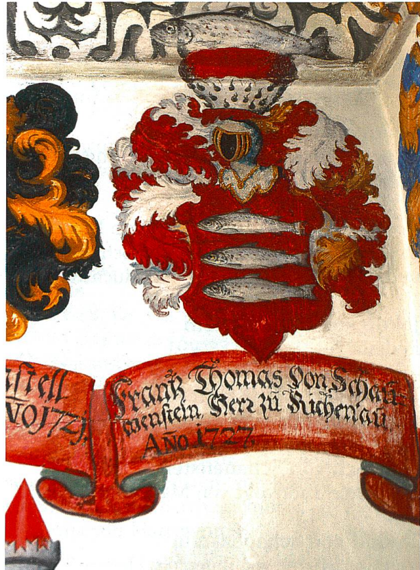
Bild 2: Stammwappen Ehrenfels. Wappen für Landrichter Franz Thomas von Schauenstein, Landrichtersaal, Cuort Ligia Grischa, Trun.

Schräglinksbalken.» Die Tinkturen können zwischen Blau, Rot und Silber variieren. Neben diesem Stammwappen adoptierte die Sippe auch das Ehrenfels-Wappen, das in Bild 2 abgebildet ist: «In Rot drei silberne Fische übereinander. Helmzier: Auf rotem Kissen mit Hermelin ein silberner Fisch.» Dieses Wappen wurde im Laufe der Zeit zum eigentlichen Stammwappen der von Schauenstein-Ehrenfels. Mit der Ernennung zu Reichsgrafen wurde das Familienwappen dann vermehrt, wie dies aus den folgenden Darstellungen hervorgeht. Das Geschlecht von Schauenstein starb mit dem Grafen Franz Thomas im Jahr 1742 aus. Durch dessen Testament blühte es aber weiter im Wappen Buol von Schauenstein . 16