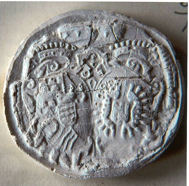
Zum Vergleich wird Bild 10 hier nochmals abgebildet, Legende wie oben.