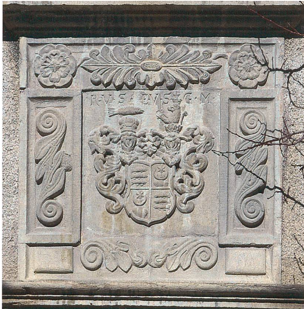
Bild 6: Allianzwappen des Rudolf von Schauenstein († 1709) und seiner Gattin Emilia de Molina. Skulptur von 1667 über dem Portal am Westflügel des Schlosses Schauenstein in Fürstenuau.