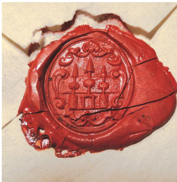
Fig. 3 – Sceau de Jean Jacques Bernard Charmillot, curé de Charmoille, 4 juillet 1749, Archives de l'ancien Évêché de Bâle, B 183/17–10.

Dans certains cas, le recours aux armoiries parlantes vise à détourner le sens d'un patronyme prêtant à la moquerie. Ainsi, la famille