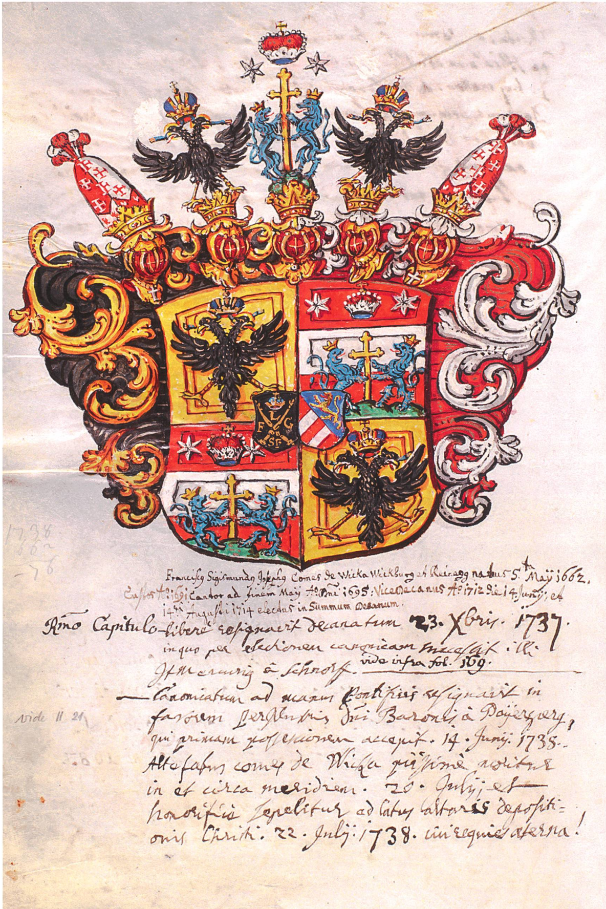
Fig. 4 – Armoiries de François Sigismund Joseph, comte de Wicka, Liber Vitae du Chapitre de la cathédrale de Bâle, f° 128 v°, Musée jurassien d'Art et d'Histoire à Delémont.