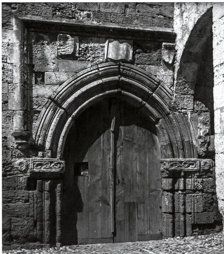
Fig. 2 Rhodes, l'auberge du prieuré d'Auvergne.

La courte période du magistère de Guy de Blanchefort n'aura donc pas permis de laisser des marques héraldiques sur l'île de Rhodes. En revanche, y subsiste un très beau témoignage de sa présence comme grand prieur d'Auvergne 42 . Le grand siège de 1480 et les tremblements de terre de l'année suivante entraînèrent de nombreux dommages aux monuments de la ville et la période suivante vit un remodelage du collachium, la construction d'un nouvel hôpital plus vaste que celui qui avait servi longtemps et l'édification de plusieurs auberges, notamment celle de France sur la grand'rue menant de l'église Notre-Dame-du-Château au palais magistral, reconstruction menée sur plusieurs