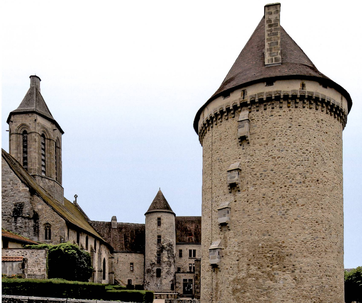
Fig. 1 Bourgneuf : La grosse tour de la commanderie construite sur les instructions de Blanchefort.

qui fut relevée 23 par l'excellent épigraphiste qui fut l'abbé Texier 24 qui nota, dans