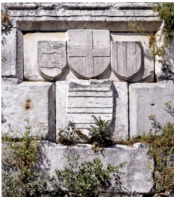
Fig. 7 Château Saint-Pierre (Bodrum, Turquie). Caisson de la contrescarpe avec les armes Blanchefort, celles de l'Ordre et l'écu Gatineau (cl. JBV).