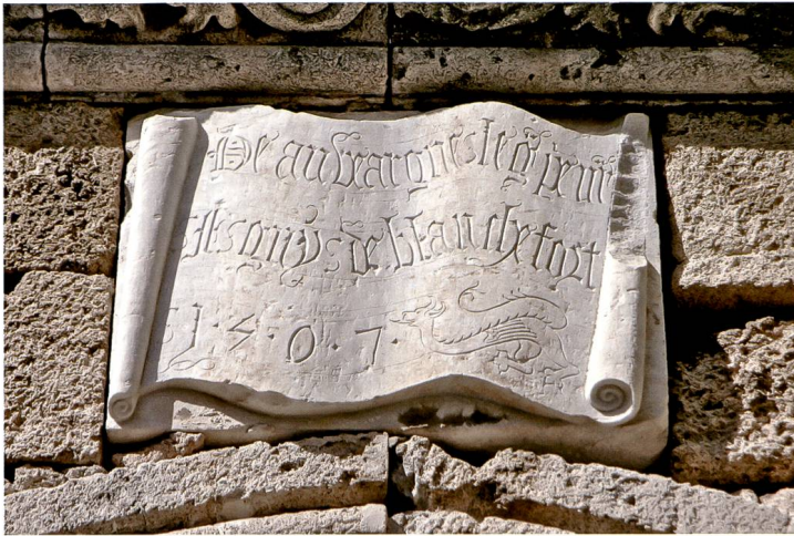
Fig. 4 Le marbre de la porte de l'auberge d'Auvergne et le phylactère donnant la date de 1507.