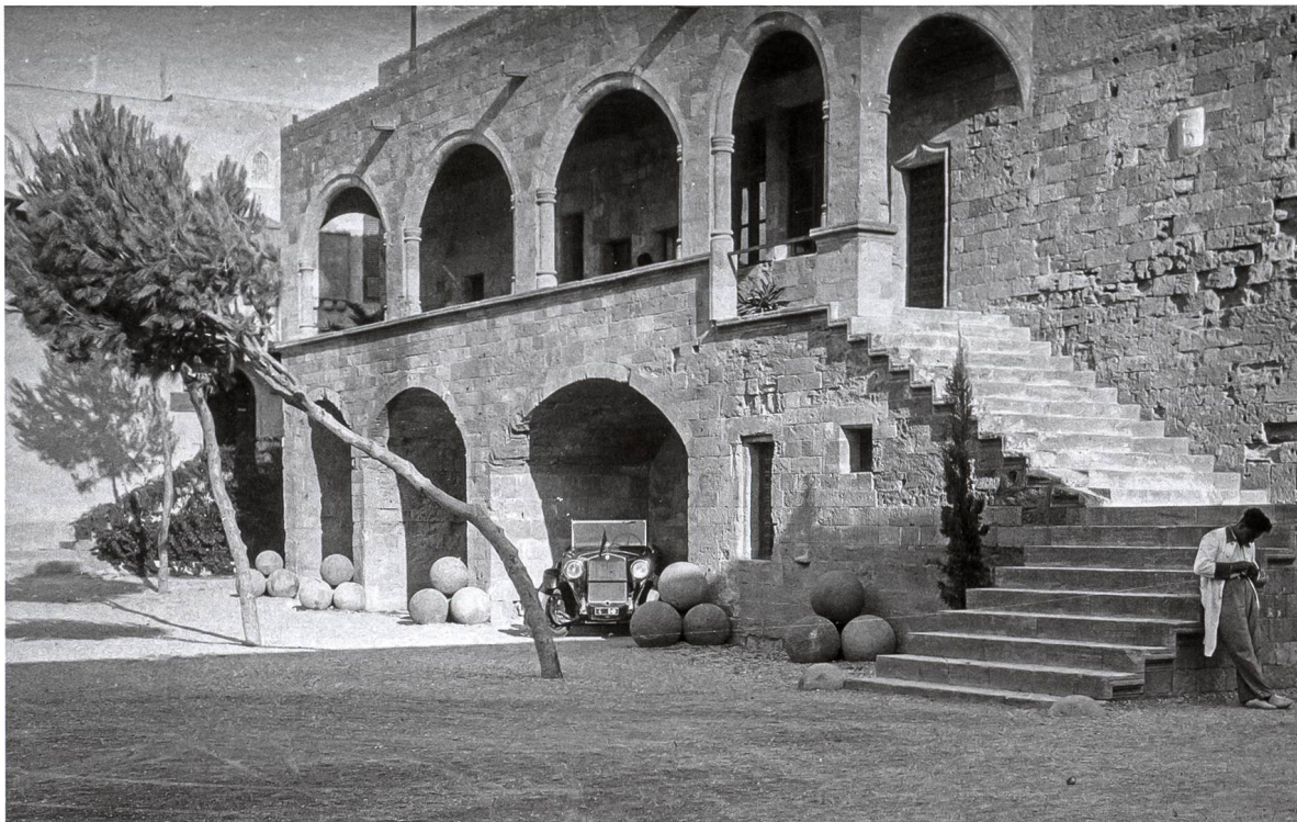
Fig. 6 Rhodes, la face nord de l'auberge d'Auvergne.

Il s'agit de fr. Jacques Gatineau 49 , commandeur de Bellechassagne, qui fut nommé capitaine du Château-Saint-Pierre le 16 mars 1512 et exerça ces fonctions jusqu'au 15 février 1514 50 . Comme beaucoup de capitaines de cette forteresse, il fit placer, sur les secteurs extérieurs des murailles ou des ouvrages militaires dont il ordonna et supervisa la construction, des caissons de pierre 51 arborant les armes du grand