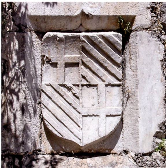
Fig. 14 Le caisson aux seules armes du grand maître Fabrizio Del Carretto placé à l'extrémité nord du moineau Gatineau lors de son achèvement en 1514.

(fig. 13), mais l'ouvrage fut achevé après le 15 décembre 1513, date de l'élection de Del Carretto, le capitaine ayant fait placer les armes de ce grand maître sur l'extrémité nord du moineau (fig. 14). Les travaux de fr. Jacques Gatineau ne se bornèrent pas là. C'est lui qui édifia également le fort bastion à qui l'on a donné son nom à la pointe nord-est du mur d'escarpe.