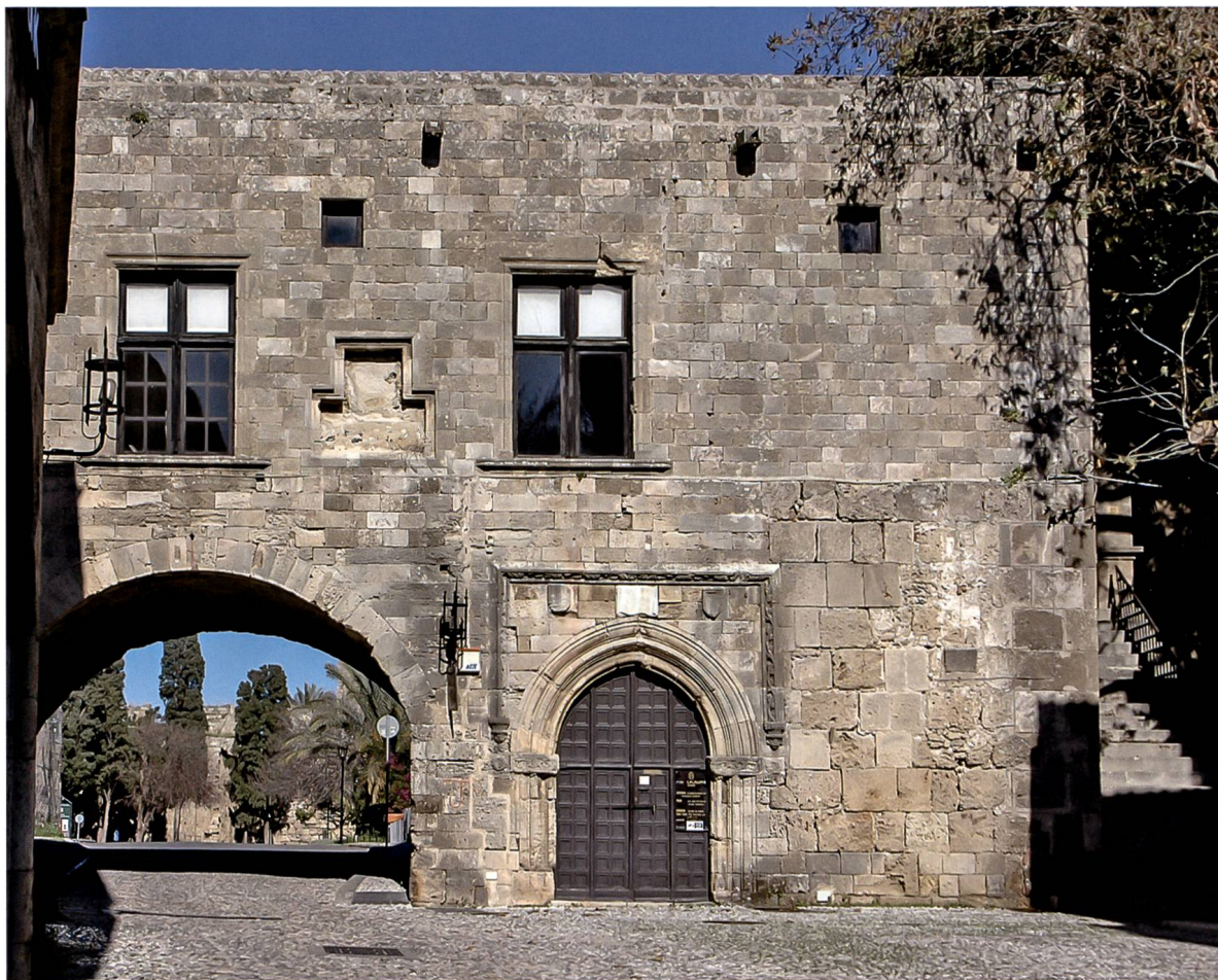
Fig. 3 Rhodes, l'auberge d'Auvergne, face méridionale.

pas manquer d'entraîner des tirs dans cette direction, provoquant de graves dommages à l'auberge, d'où sa reconstruction par le grand prieur d'Auvergne en 1507.