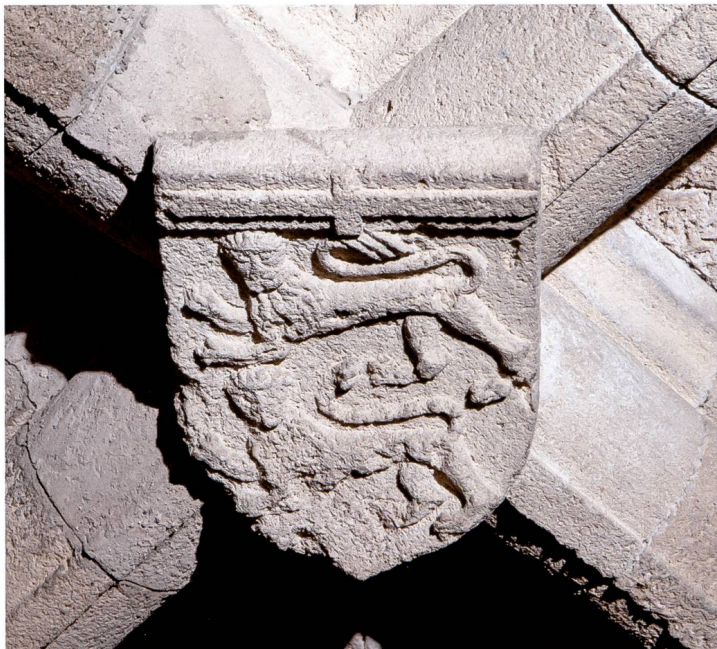
Fig. 5 Rhodes, la clé de voûte aux armes du grand prieur Blanchefort dans la première salle de l'auberge (cl. JBV 1983).

DE AUVEARGNE LE G[rand] P[r]EUR FR[ere] GUY DE BLANCHEFORT 1 . 5 . 0 . 7 et le dessin d'un dragon bipède tirant la langue