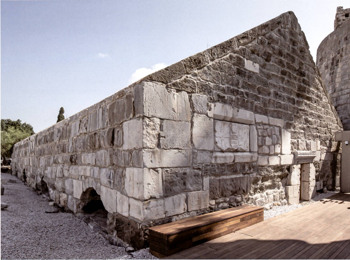
Fig. 11 Le moineau Gatineau. Sur la face sud, un caisson avec les armes de l'Ordre et Blanchefort et un écu Gatineau.

Sous ce caisson un marbre barlong sur lequel il fit graver: