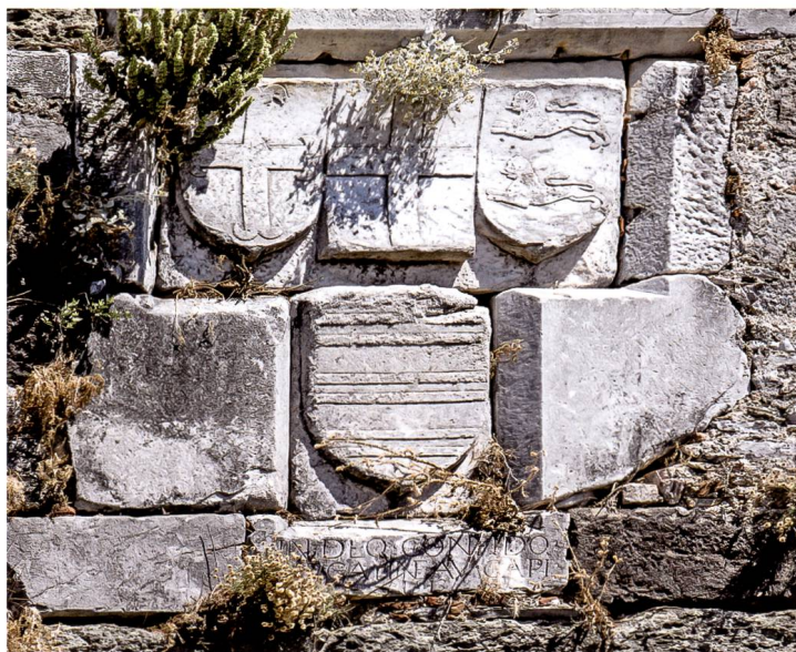
Fig. 9 Caisson de la contrescarpe avec les armes Aubusson et Blanchefort et l'écu Gatineau avec la date, 1513, en partie cachée.

S'attaquant à la section la plus occidentale du dispositif au cours de l'année 1513, Gatineau l'acheva en faisant construire ce qui deviendra la première porte dans le système des accès définitifs au château. Sur la face interne de cette porte, il fit, aux côtés d'un lion antique provenant du mausolée d'Halicarnasse, placer un caisson avec deux grands écus, l'un aux armes de l'Ordre, l'autre portant celles du grand maître Blanchefort et,