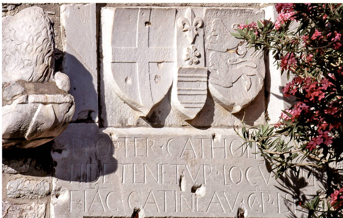
Fig. 10 Décor de la face interne de la porte franchissant la contrescarpe. Les armes de l'Ordre et de Blanchefort et, au centre, un écu Gatineau. La date de 1513 à la fin de l'inscription.

entre les deux, un écu de plus petites dimensions avec ses propres armes surmontées d'une fleur-de-lis en relief et d'une sextefeuille (fig. 10).