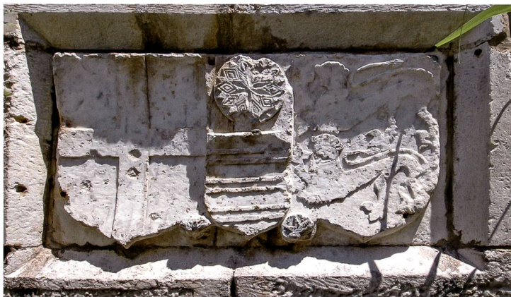
Fig. 12 Le caisson aux armes de l'Ordre et Blanchefort de la face sud du moineau.