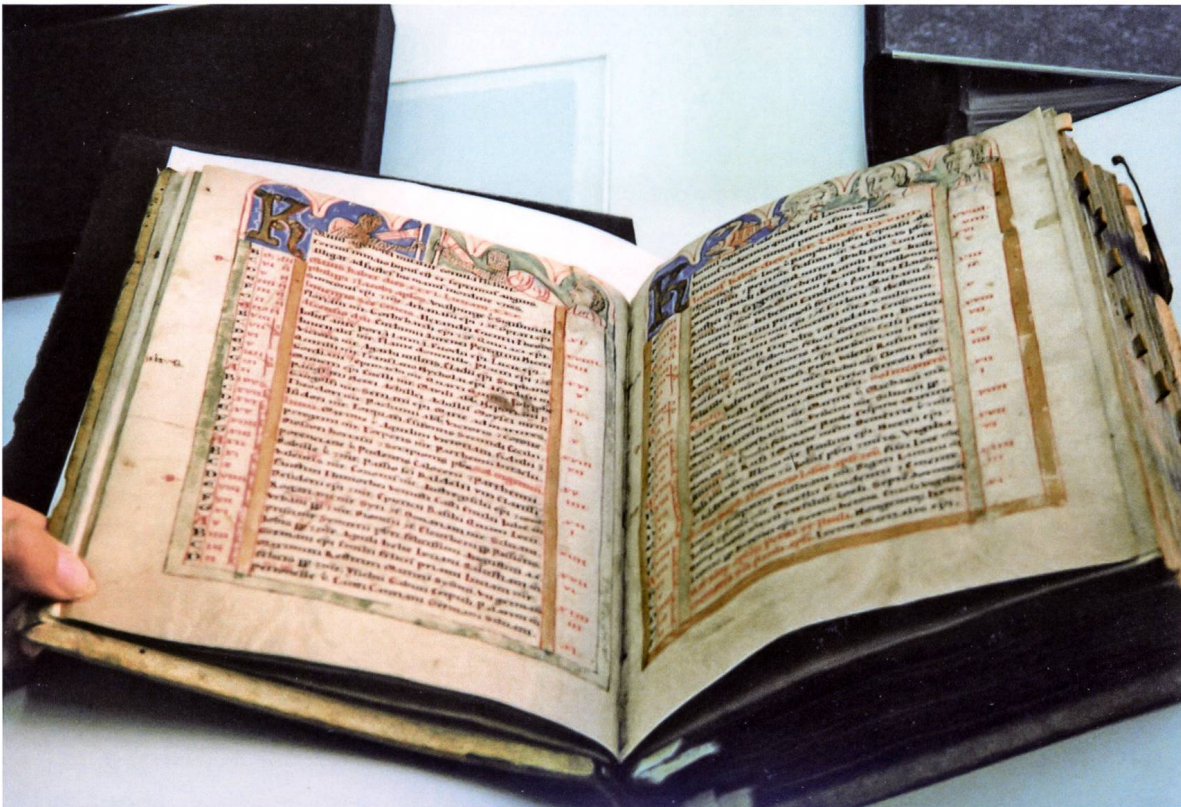
Abb. 1: Psalterium Davidis, Münchener Ausgabe, Foto: Bayrische Landesbibliothek München.

Ein besonderes Kleinod stellt das Psalterium Davidis für das Prämonstratenserinnenkloster Mariatal-Weissenau 1 des Jahres 1196 dar.