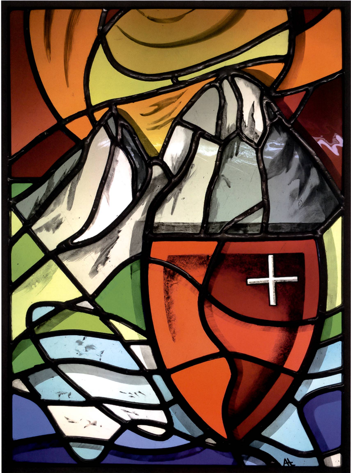
Neue Standesscheibe des Kantons Schwyz von Antoinette Liebich, 2019 (Foto: Rolf Kälin).