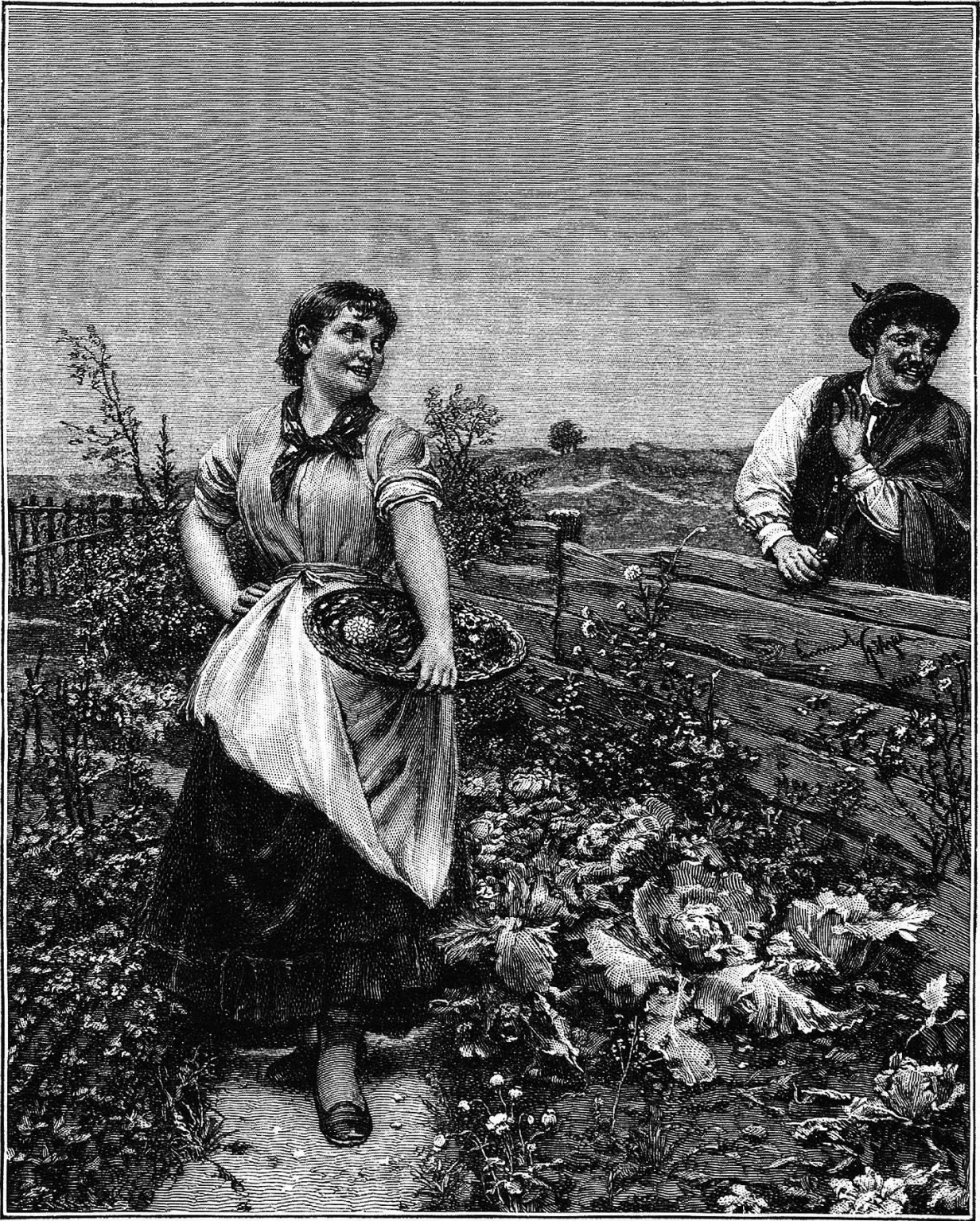
„Abgeblüht.“ Nach einem Gemälde von Emanuel Spitzer.