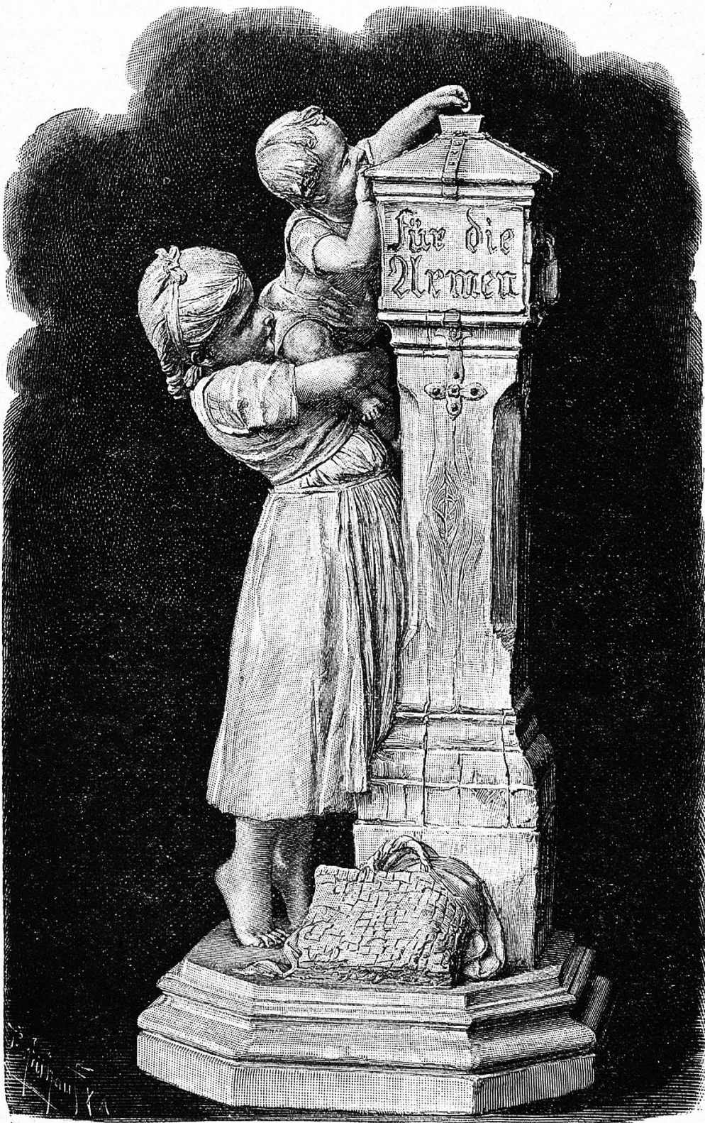
Marmorgruppe von Georg Busch.