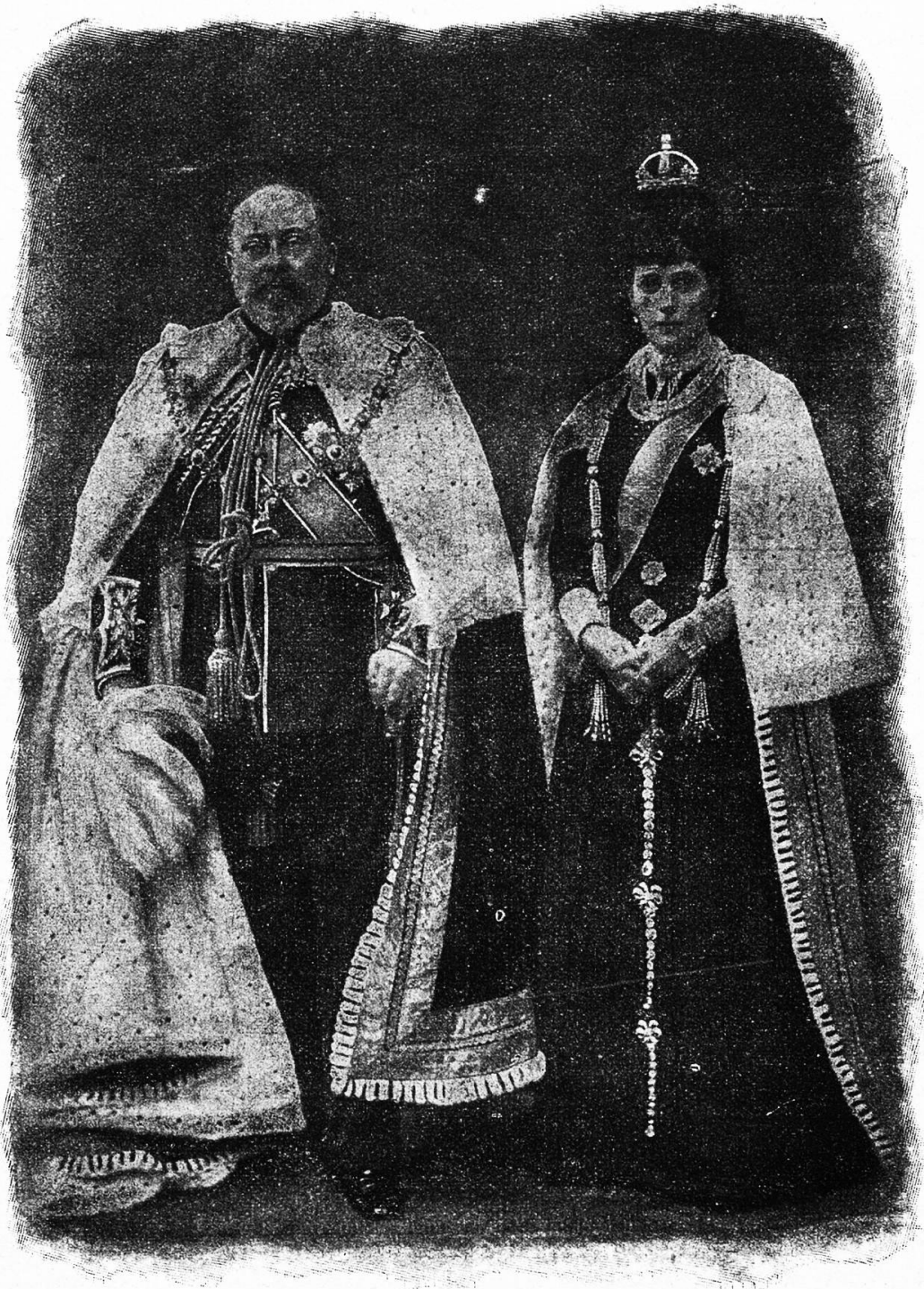
König Eduard mit Gemahlin im Krönungsornat.

verschiedensten Ingredienzen hergestellt, u. a. aus Jasmin-, Rosen- und Zimtöl. Es wird erzählt, daß König Jakob II. bei seiner Salbung für das heilige Del dem Apotheker, der es herzustellen hatte, die ansehnliche Summe von viertausend Mark bezahlt habe. Ebenfalls aus dem 12. Jahrhundert stammt der Löffel, auf den das Salböl geträufelt wird. Das Zeremoniell der Salbung ist äußerst umständlich und feierlich. Nachdem der König sich auf den ebenfalls uralten Thronstuhl in der Abtei von Westminster niedergelassen hat, legt der Dekan die Ampulla und den Löffel auf den Altar nieder. Der Erzbischof salbt alsdann den König mit einem Kreuze auf den Scheitel und beide Handflächen; auf den Scheitel als den Sitz der Gedanken und der Rede, auf die Hände als auf die Werkzeuge der Handlung. Erst nachdem diese Salbung vollzogen, empfängt