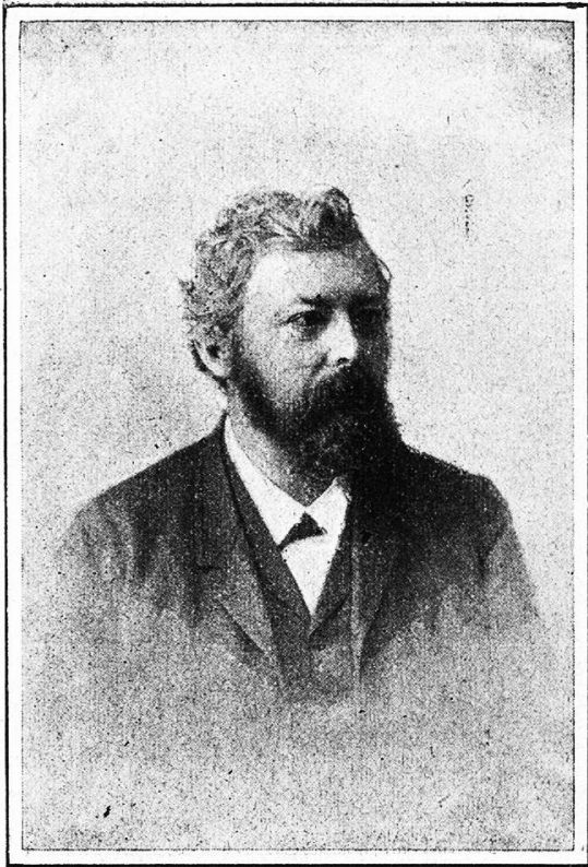
Bundesrat Dr. Ludwig Forrer.

Indessen war die demokratische Bewegung der 60er Jahre in Fluß geraten und der jugendliche Feuergeist Forrers nahm bald einen hervorragenden Anteil daran. Der Verfassungsrat wählte den 23-jährigen zum indirekten Mitglied und ersten Sekretär; zwei Jahre später finden wir ihn als ersten Staatsanwalt und Kantonsrat.