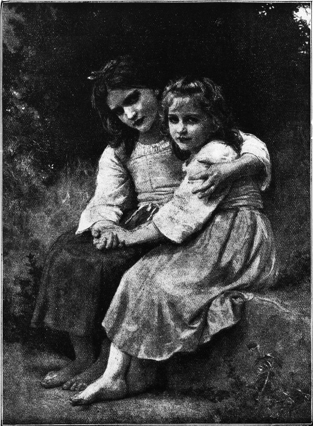
Freundinnen. Nach dem Gemälde von Bouguereau.