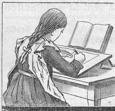
Schreib- und Lernpult

Aufbewahrung und Verwaltung von Wertpapieren, Vermittlung von Kapitalanlagen, Geldwechsel etc.