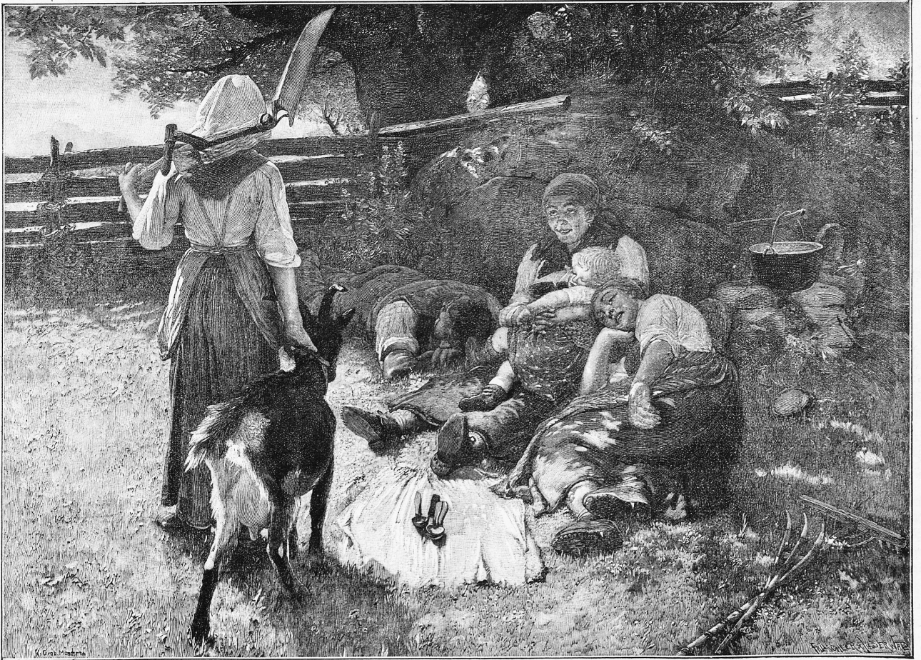
Mittagsrast. Nach dem Gemälde von Konrad Grob.

Der Schöpfer dieser heimlichen Scene, der Schweizer Konrad Grob, im Jahre 1828 zu Niedervil bei Andelfingen, von armen Eltern geboren, ist, durch eigene Kraft zum anerkannten Meister emporgestiegen, dessen Werke in allen Welttheilen zerstreut sind, im Januar dieses Jahres in München gestorben. Im Basler Museum hängt wohl sein Hauptbild: Pestalozzi in Stans. Die Liebe zum Gegenstand, welche aus jenem herrlichen Bilde zu uns spricht, erfüllt auch das vorstehende. Der Künstler, der zeitlebens ein eifriger