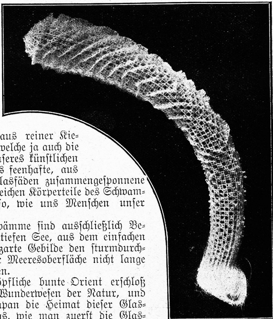
Ein wunderbares Naturgewebe (Glasschwamm.)

Der unerschöpfliche bunte Orient erschloß uns zuerst diese Wunderwesen der Natur, und noch heute ist Japan die Heimat dieser Glaskünstler. Anfangs, wie man zuerst die Glasschwämme zu Gesicht bekam, glaubte man es nicht mit einem Tier, sondern mit Glasbläserkunst-