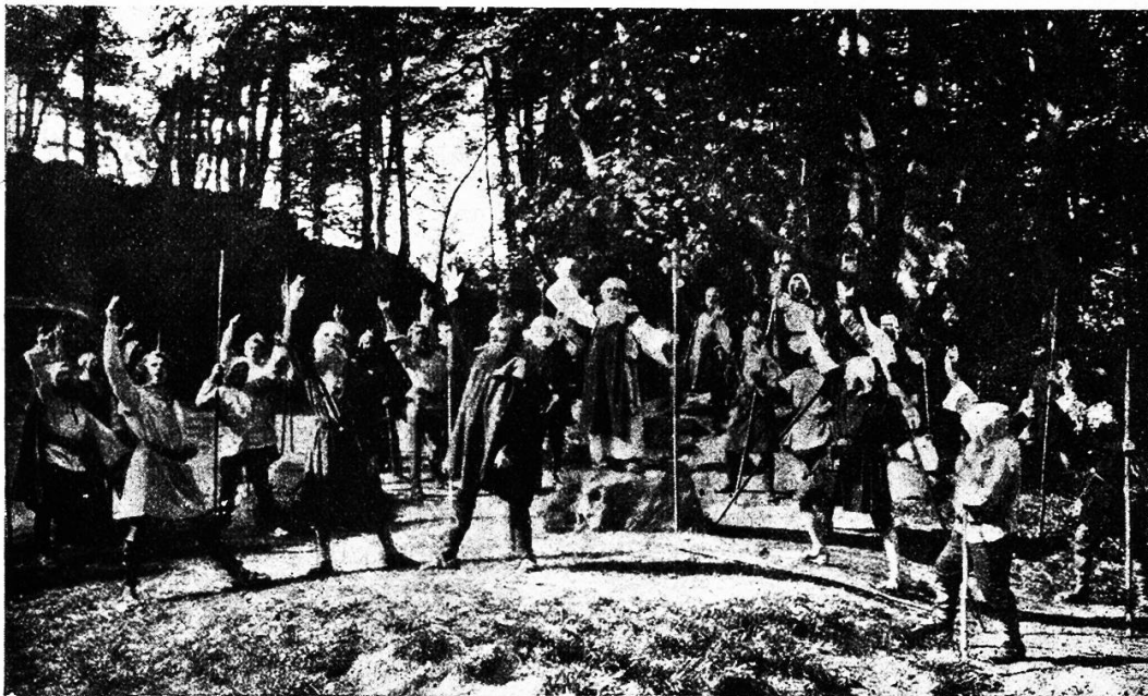
Rüttlschwur — „Wir wollen sein ein einzig Volk von Brüdern.“

Dichter wieder rein zum Worte kommen zu lassen und die Schweizer wieder zu Schweizern zu machen.