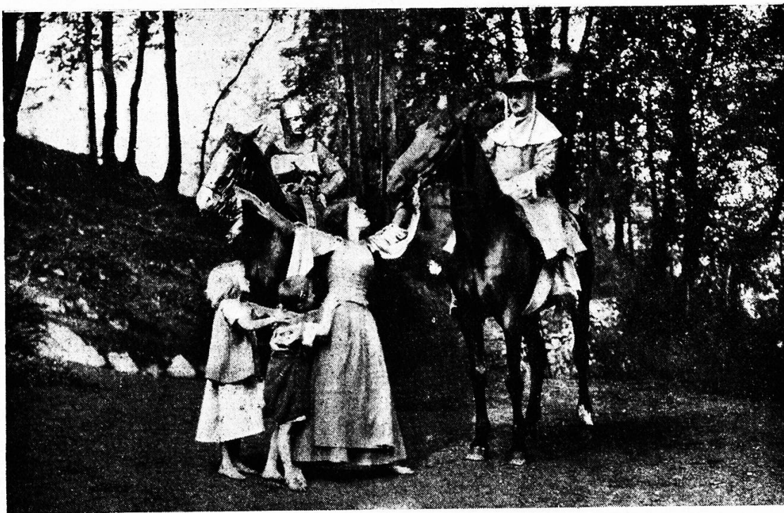
Szene aus der „Hohlen Gasse“.

Der Schauplatz in Interlaken — eine „Bühne“ ist es, wie schon gesagt, nicht! — ist eine ausgedehnte, halbmondförmige Waldwiese in einem stillen, vom Lärm des Fremdenortes nicht berührten Winkel des Jugs. In überaus malerischen Linien zieht sie sich aufwärts zur Felskuppe, von herrlichen Bäumen bestanden und umgeben, von wirksamen Felsgruppen unterbrochen, in abwechslungsreicher Gliederung von Anhöhen, Einsenkun-