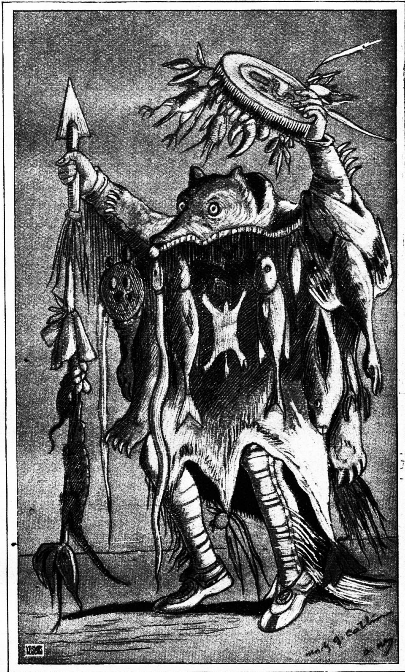
Abb. 3. Der Medizinmann oder Krankheitsbeschwörer der Schwarzfuß-Indianer. Nach einer Zeichnung Catlins.

! Der Weiße verachtet die Bemalung des indianischen Körpers und dessen Kopfsputz und sieht im Indianer einen Wilden mit rohen Instinkten. Wohl mit Unrecht! Warum trägt der Indianer seinen Kopfsputz aus