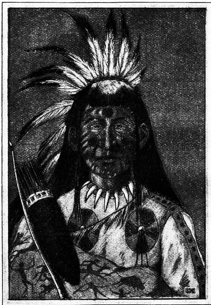
Abb. 2. Der Häuptling der Schwarzfuß-Indianer. Nach einer Zeichnung Catlins.

priester, Propheten und Häuptling, „dem tollen Wolf“, adoptiert und seiner blonden Haare und blauen Augen wegen „Ape-étsche-ken“, das weiße Wiesel, genannt.