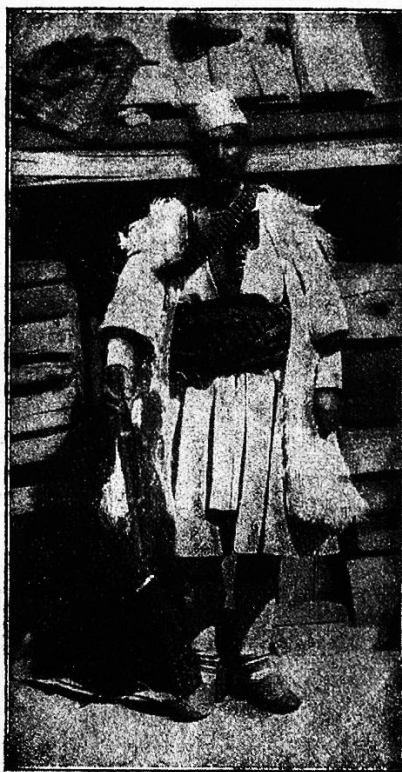
Aromune aus Pisditsa (rumänisch).