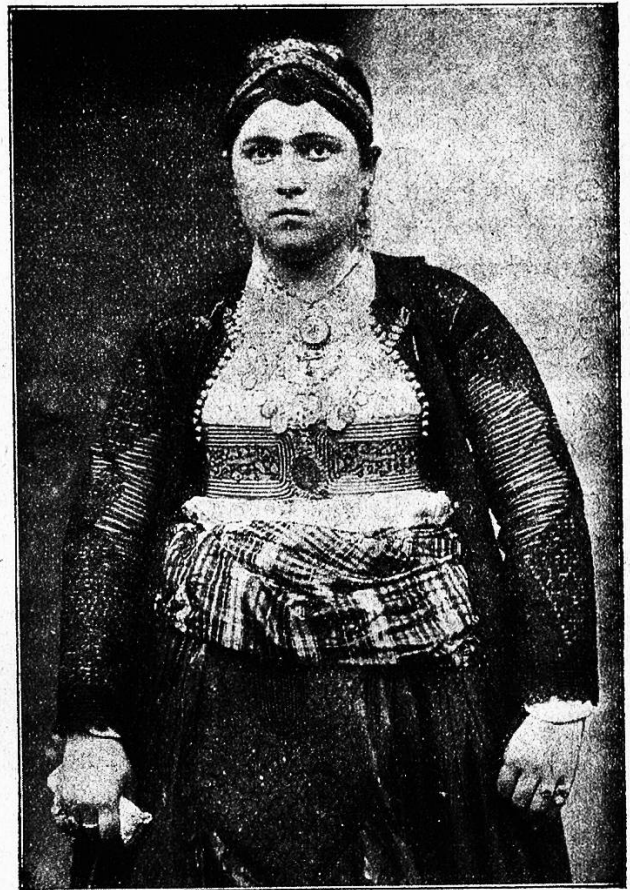
Gegin aus Nordalbanien.

Einverleibung eines Teiles von Serbien (Nisch-Laskowak), der slawischen Gebiete Makedoniens und einiger Häfen am Ägäischen Meer. Auf Serbien ist es besonders auch deshalb erbittert, weil sein Siegeszug in dieses Land im Jahre 1885 durch Einspruch Osterreich-Ungarns aufgehalten und seine Ansprüche bei Friedensschluß nicht berücksichtigt wurden. Auch zu Rußland besteht keine rechte Freundschaft, trotzdem dieses Reich im vorigen Jahre Bulgariens Schulden an die Türkei in Höhe von 65,5 Millionen übernommen hat.