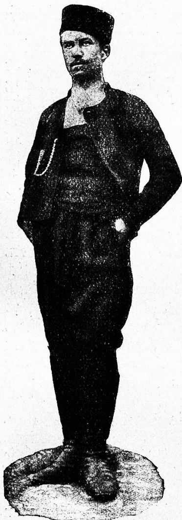
Bulgare aus der Dobrudscha.

Die Griechen, die unter den eigentlichen Balkanvölkern bei weitem das geistige Übergewicht besitzen, bewahren gegenüber den Zuwachsbestrebun-