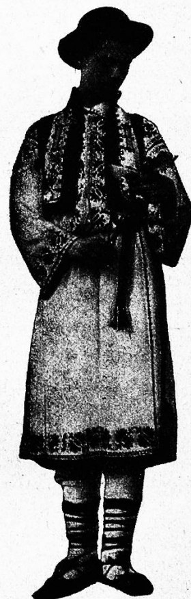
Rumäne aus Johomitsa.

gen derselben eine gewisse Zurückhaltung und sind mit ihren Grenzen vorläufig zufrieden, das heißt so lange nur, bis die makedonische Frage wieder ins Rollen kommt; sie glauben nämlich ebenfalls auf dieses Gebiet sowie auf Epirus Anspruch erheben zu dürfen. Und doch ist Makedonien keineswegs griechisch. Nach Weigands Schätzung, des besten Kenners der ethnographischen Verhältnisse auf der Balkanhalbinsel, sind von den 2,275,000 Seelen zählenden Bevölkerung Makedoniens über die Hälfte (1,200,000) Slawen und nur der zehnte Teil (220,000) Griechen;