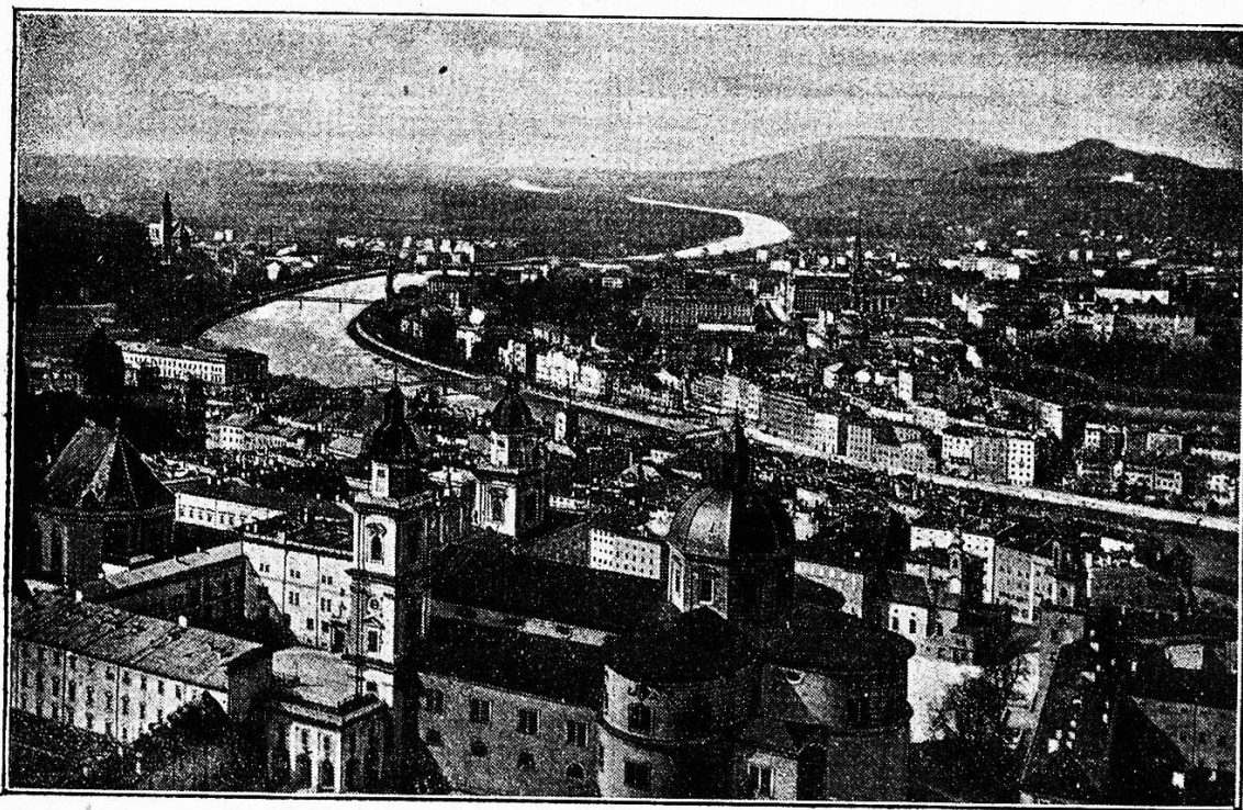
Salzburg von der Festung.

Wie sollte sich da nicht munter und lustig an Kletterstange und Strickleiter, auf Schaukel, Reck und Barren die frische Jugendkraft erproben lassen.