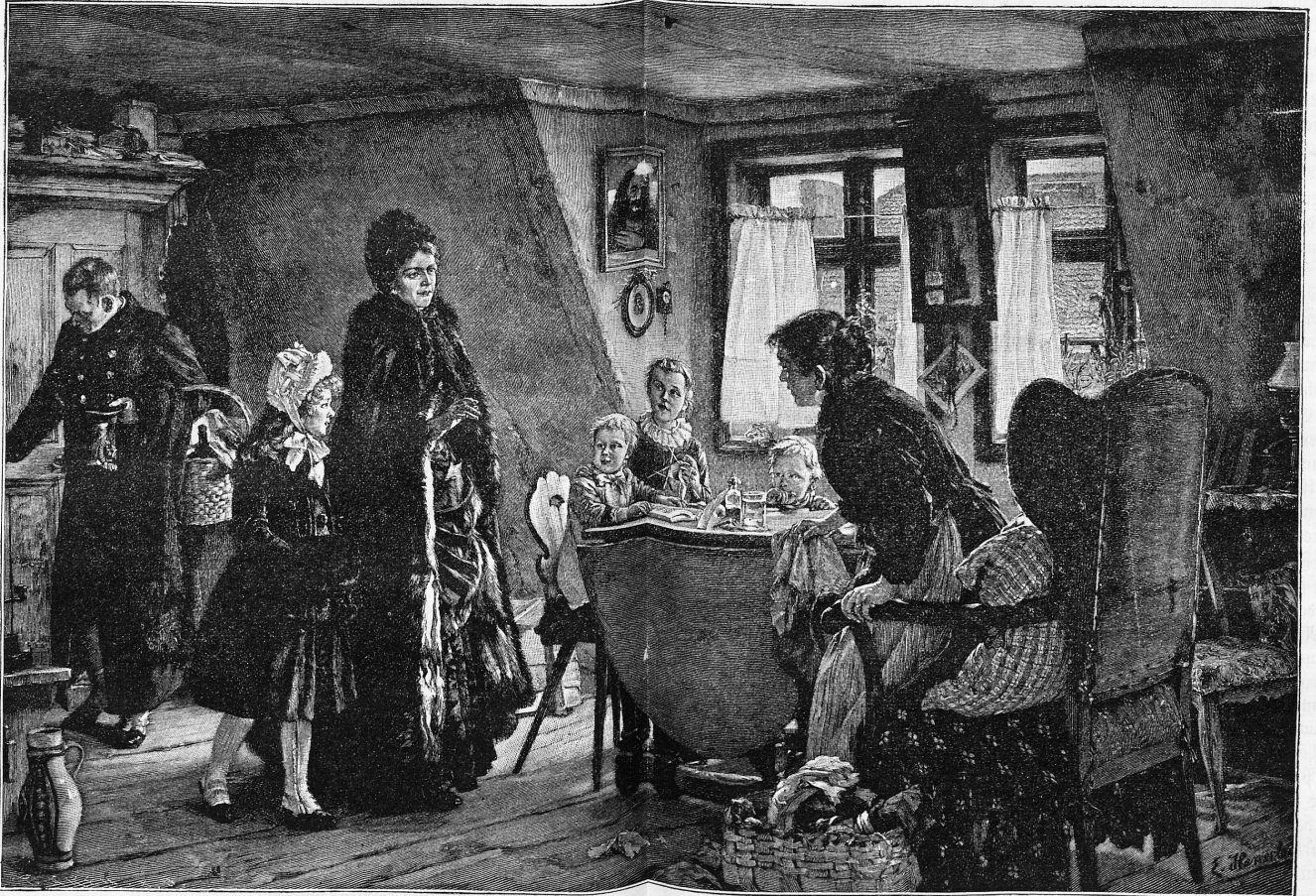
Die Wohlthäterin. Nach dem Gemälde von E. Henkefer.