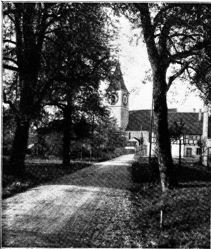
Das Kirchlein in Kilchberg bei Zürich.

Damit gab sie ihm ein halbes Duzend neuer Säcke, die sie aus dem von ihrem Mann gewobenen Tuche genäht hatte.