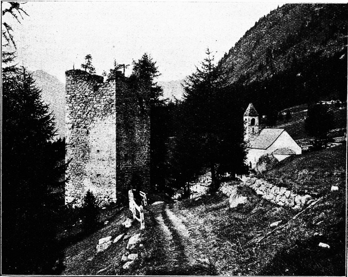
Kirchlein St. Maria und alter Wachturm „Spaniola“ bei Pontresina.

Wir sind ja auch endlich der vielen Schnörkel und des vielen falschen Pathos, das sich in allen Zweigen der Kunst breit machte, überdrüssig geworden.