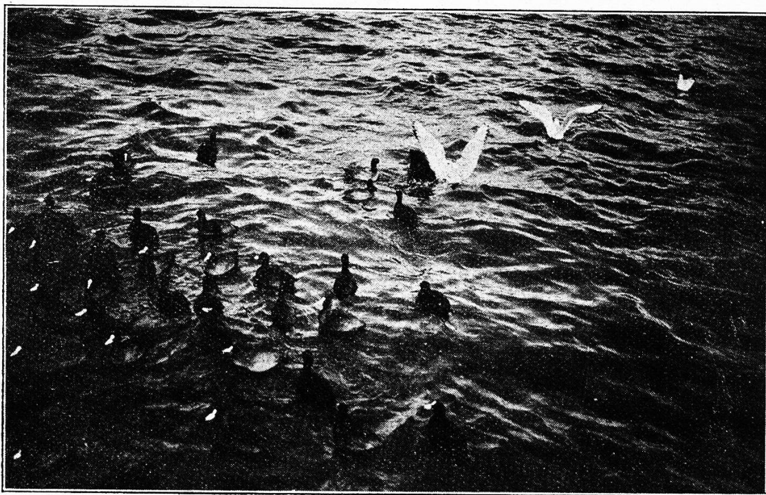
Winterbild aus Zürich. Möven und Wildenten auf dem Zürichsee.

Die zweite Kategorie Bilder hatte ich nun zum Schluß mit Entschiedenheit für Produkte von Kindern unter 7 Jahren gehalten. Etwa eine halbe Stunde lang hatte ich die Bilder erst von nah und von fern, von allen Seiten, gerade stehend, mich seitlich tief nach links und rechts neigend, einmal, als gerade niemand anwesend war, sogar zwischen den Beinen durch betrachtet, weil ich vermutete, die Bilder könnten auch verkehrt aufgehängt sein, aber es half alles nicht: ich sah nichts als breite Linien, blau, rot, braun, grün, gerade, eckig, meist spiralförmig, dazwischen farbige Flecke in ganz ungebrochenen Farben, alles durcheinandergemengt und gezogen. Die Flecke waren vielleicht Rosen, oder rote Lippen, oder verschmizt lachende Augen, man konnte alles daraus machen, die Phantasie hatte freies Spiel, wie die Phantasie eines Kindes. Aber richtig, ja, natürlich, nun schämte ich mich ordentlich, daß ich nicht eher darauf gekommen war: Es gab ja jetzt auch