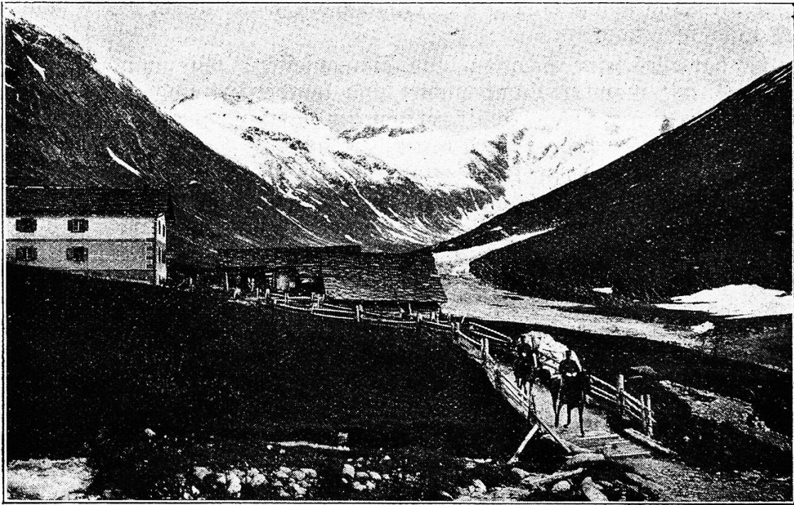
Juf im Abers-Tal, Graubünden, 2042 m. Höchster jahraus jahrein bewohnter Ort von Europa.

angestaunt. Ich meinerseits mußte feststellen, daß bei gleichen Talenten die ältern Maler allzusehr zu Verstand und Gemüt sprachen, auf Kosten der farbigen Realität. Alles scheint natürlich und lebensvoll gemalt und doch sagt dagegen die Auge des modernen Malers: nein, das ist gerade unnatürlich; so denkt man sich wohl, aber so sieht es in Wirklichkeit in der Natur kein Auge. Wie wären zum Beispiele bei diesen Gestalten diese ungebrochenen, blauen, roten und violetten Farben der Gewänder im Walde möglich, oder dieser, nirgends veränderte ideale Fleischton der schönen Nixen im Waldwasser. Das Grün des Waldes, das direkt und indirekt auf die Körper fallende Sonnenlicht, all das verändert die natürliche Farbe einer Gestalt, eines Körpers. Aber davon ist bei Euch nichts zu sehen. Ihr habt diese schönen Sachen vielleicht mit innerm Auge gesehen, und in eurem Atelier gemalt, aber in der Natur sieht dies alles ganz anders aus.