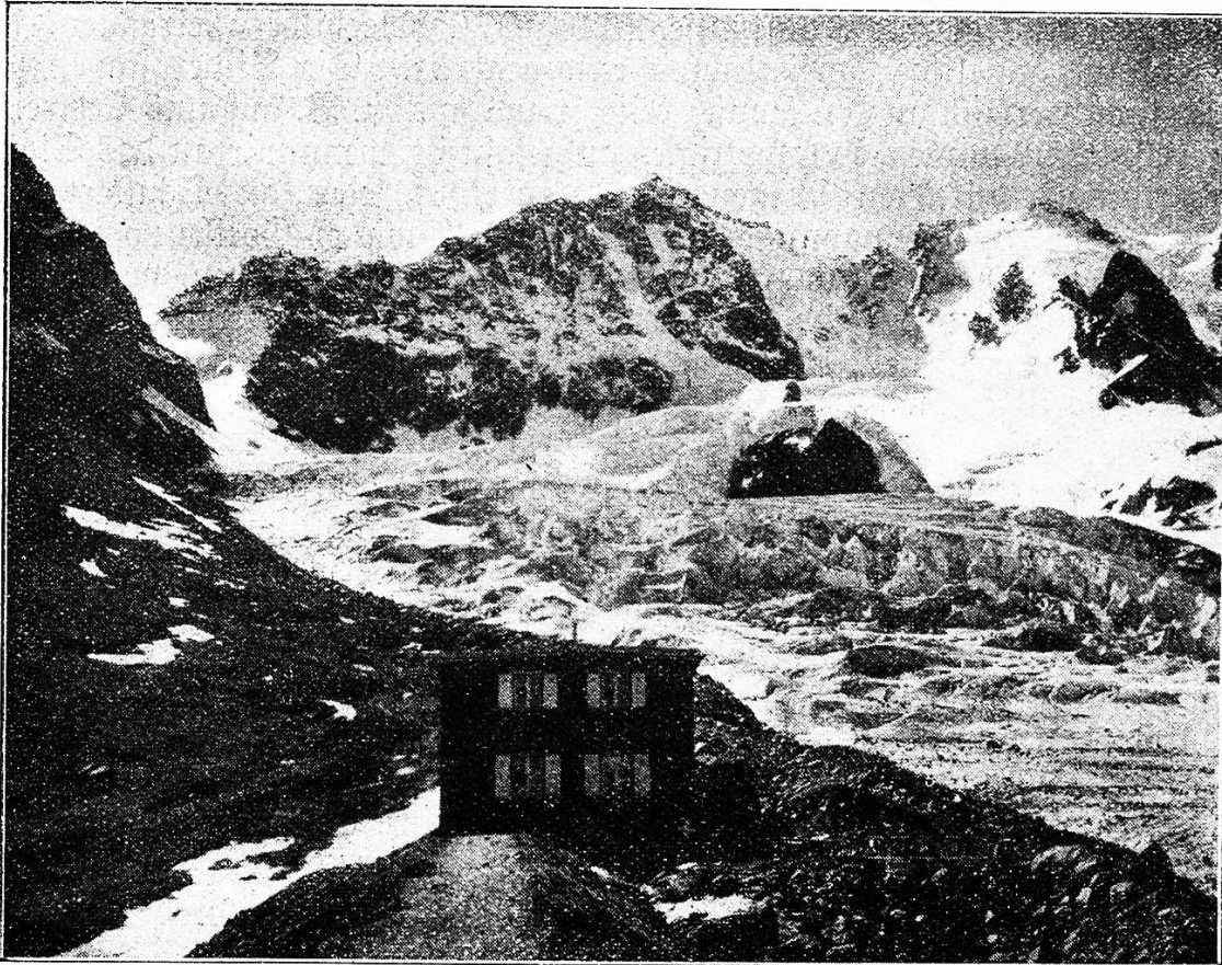
Biz Vernina (4052 m) mit Tschierba-Hütte.

Musiker, malende Philosophen, malende Epiker auf den Plan treten; es kommen die Impressionisten in allen Schattierungen. Eben durch das neue Schauen hat sich ihr Auge eigenartig entwickelt, sie haben Farben in der Natur gefunden, die man früher gar nicht sah oder nicht sehen wollte. Auch sind sie dahinter gekommen, daß unser Auge nur eine Unmasse Farbflecke wahrnimmt und der Verstand es ist, der all diesen Flecken und Linien Sinn und Zusammenhang gibt, und daß, wenn man die Flecke in gleicher, ja auch nur annähernd gleicher Weise auf die Leinwand bringt, wie sie auf die Netzhaut unseres Auges fallen, man auch die gleiche Wirkung, wie die unmittelbare der Natur hervorbringen kann.