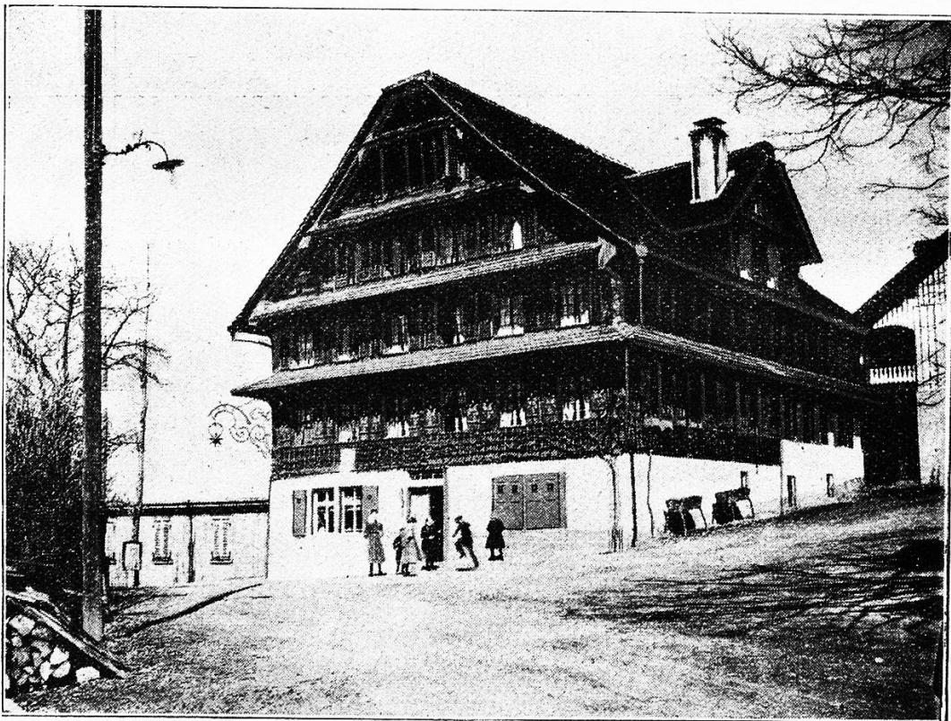
Gasthaus zum Sternen, Walchwil.

Die eigenartige Tektonik des Zugerberges, der seinen Fuß in einem