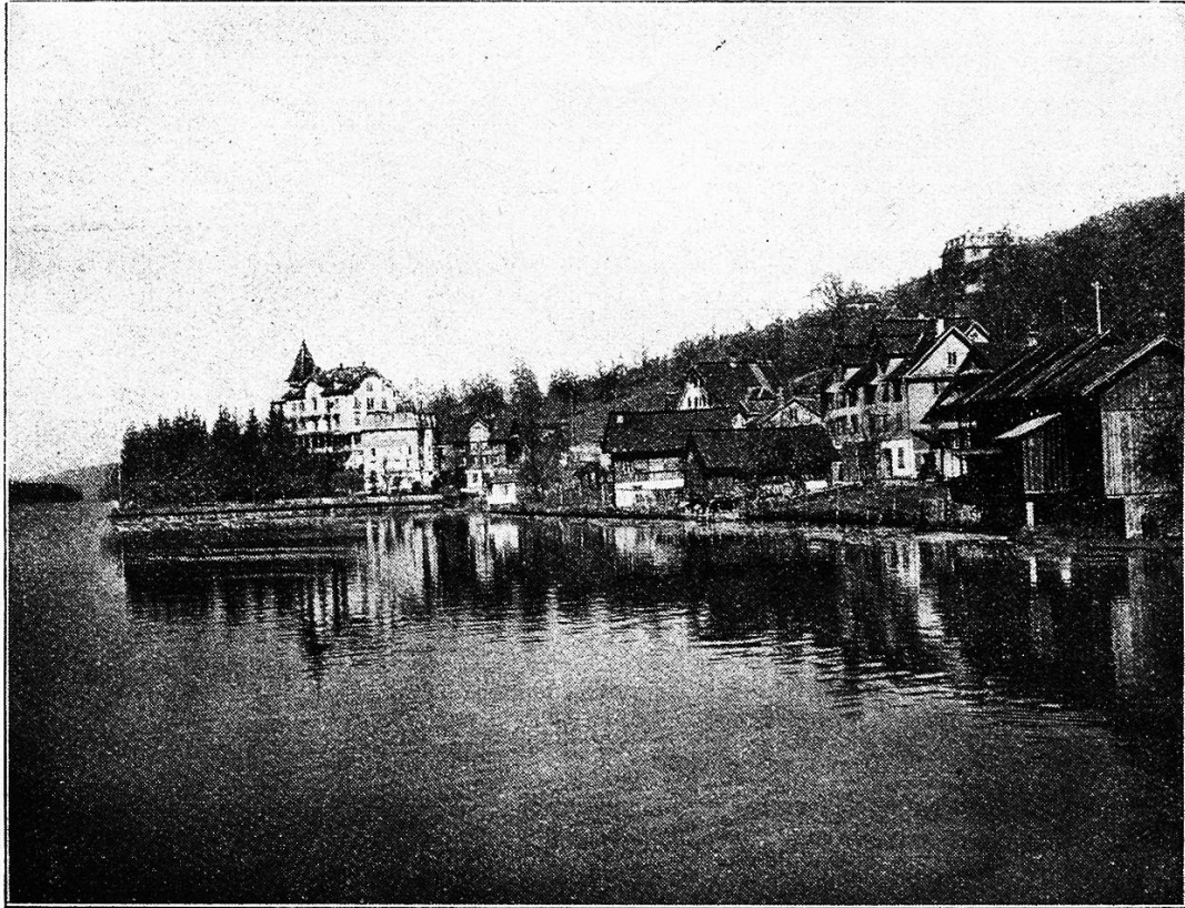
Walchwil am Zugersee.

Und weiterhin treten wir ein in einen herrlichen Naturgarten, in dessen sonnigen Winkeln und Ecken wir die Wirkungen eines geschützten Klimas er-