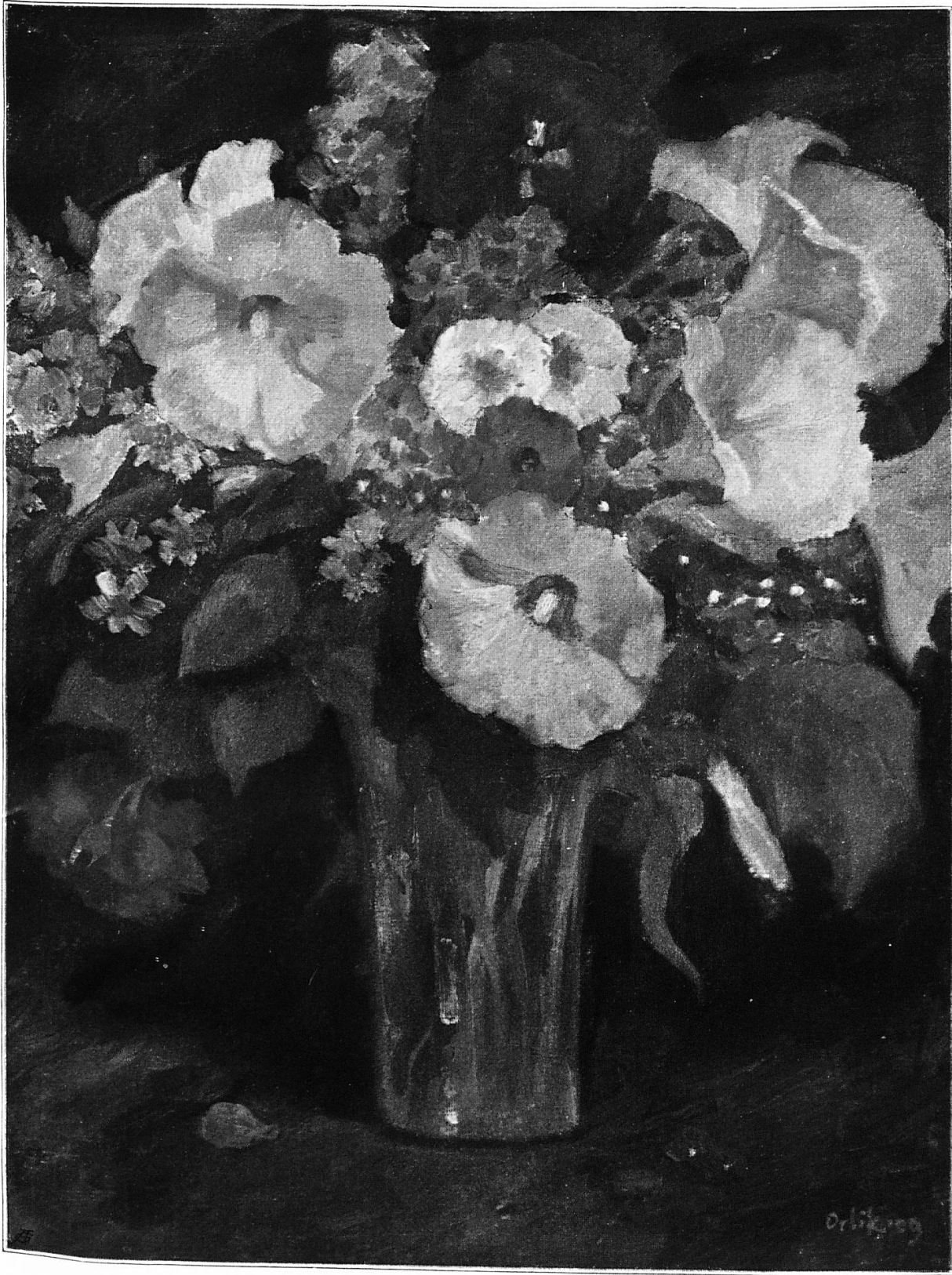
Stilleben. Gemälde von Prof. Emil Orlik.