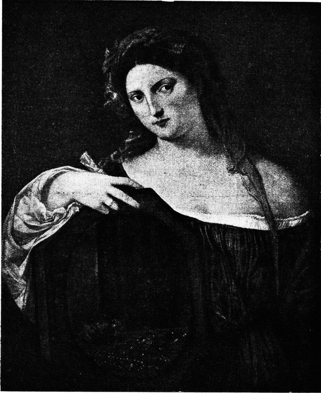
Titiano Verellio. Die Eitelkeit des Irdischen.