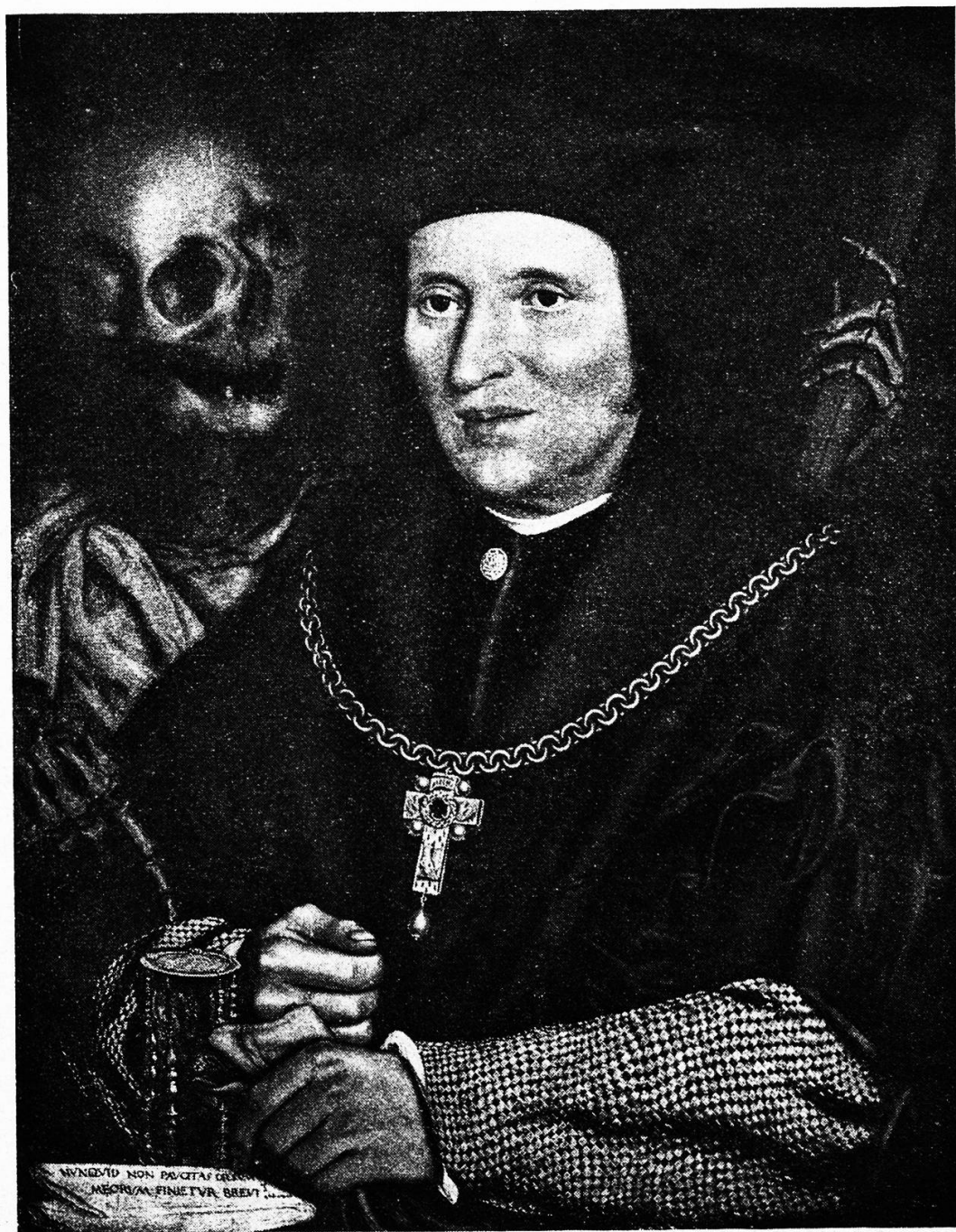
Hans Holbein d. jüing. Bildnis des Schatzmeisters Bryan Tuke.