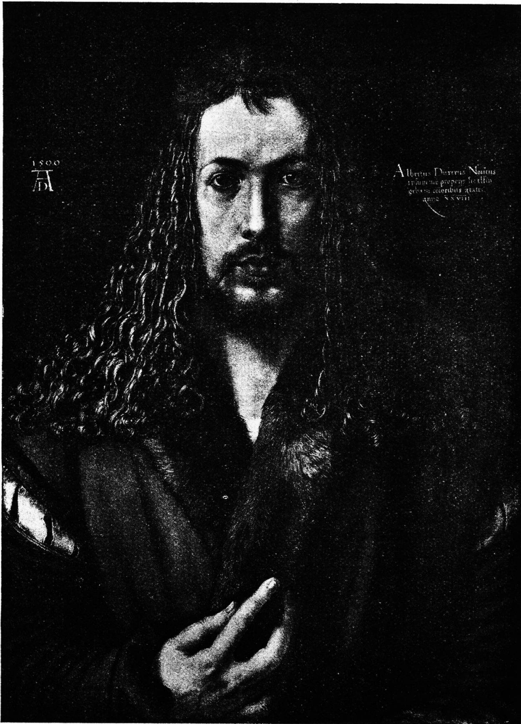
Albrecht Dürer, Selbstbildnis des Künstlers.