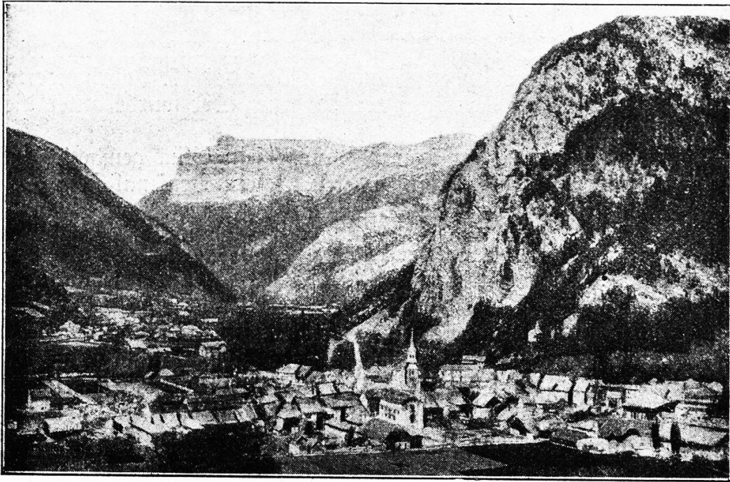
Das Dorf Thones und der Parmelan (1855 m).

Tournette, die wir bis jetzt stets nur von vorne gesehen. Schneller schießen die schneeigen Wasser des Fier zu Tal. Wir sind in Thones. Mitten vom Bergeskranz umschlossen, bildet das freundliche Städtchen mit seinen alten Arkaden, der schmucken Kirche, deren Turm im 16. Jahrhundert aus den Steinen des „alten Schlosses“ erbaut war, eine Touristenstation erster Ordnung. Vier Täler laufen hier zusammen. Hier geht's nach Grand Bornard und Saint-Jean-Sixt, dem Stelldichein der Gemsen- und Murmeltierjäger. Dort über den Col des Aravis nach Chamonix. Hätten sie die Fremden nicht, die Gegend wäre übel dran, denn Grund und Boden ist mager, die