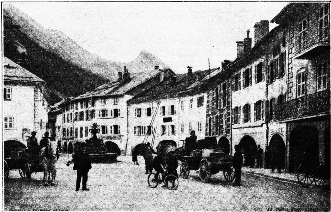
Thones mit Dorfplatz.

Am 7. Mai 1793 marschierte die Bürgerwehr, aus Thones und den um-