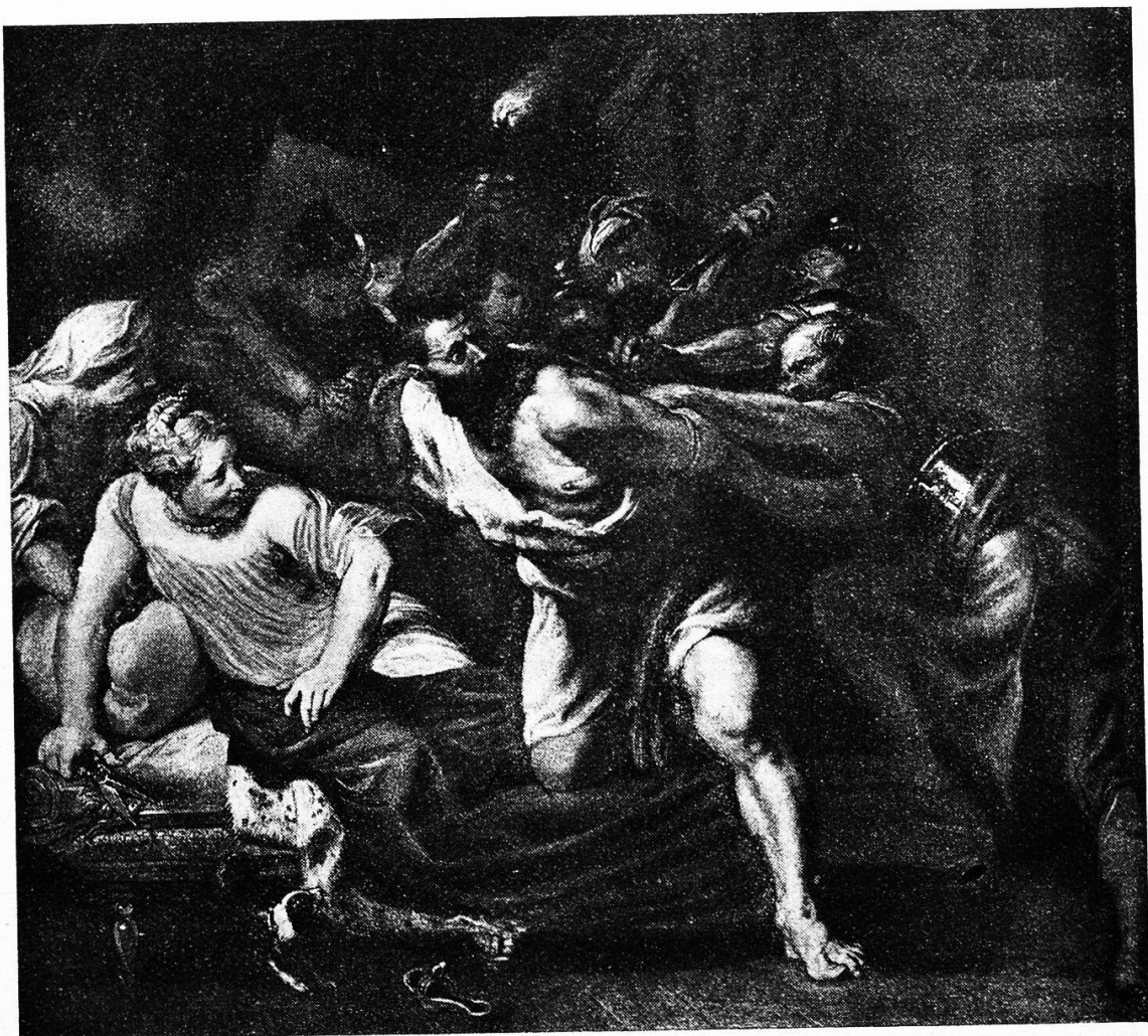
Peter Paul Rubens. Die Gefangennahme Simsons.

h e n s gewaltigem Werk weht bereits etwas von solchem Wesen da und dort hinein. Fast übermäßig quellen manchmal die Formen, leuchtet das blühende Fleisch. Riesenkraft des innern Schauens läßt ihn seine jüngsten Gerichte, den Höllensturz der Verdammten, mit Strömen von Gestalten füllen. Dabei lenkt seine künstlerische Simsonsstärke und beherrscht vollkommen jeden Formenstrom. Ich sah allerdings manches Jungfräulein mit krausem Näschen an den mächtigen Leinwänden vorübergehn, auf denen seine Farben- und Formüppigkeit wahre Orgien feiert. Seine fleischigen, blonden Niederländerinnen als Modelle darf man eben auch nicht vergessen, und immer macht sich ja doch der Einfluß edler italischer Schule noch fühlbar. Rubens lebte und malte nicht umsonst während achten seiner Zwanzigerjahre in Italien. Erst weit später, als er für die Höfe von Frankreich, Spanien und England, an Gemälde gehn mußte, die viel allegorische Gedanken und Zutaten enthielten, spielte das prunkhaft Unwahre zuweilen hinein. 1200 Bilder von seiner Hand sind nachgewiesen — und, meist, welcher Ausmaße! Freilich arbeiteten da Schüler mit, denn der Meister war ein sehr großer Herr geworden, der an fremden Höfen auch als Diplomat stattlich mitwirkte. Da litt natürlich zuweilen die Innigkeit und das tiefere Durchdenken der Ausführung, besonders religiöser Motive. Als Bildnißmaler ist Rubens ganz