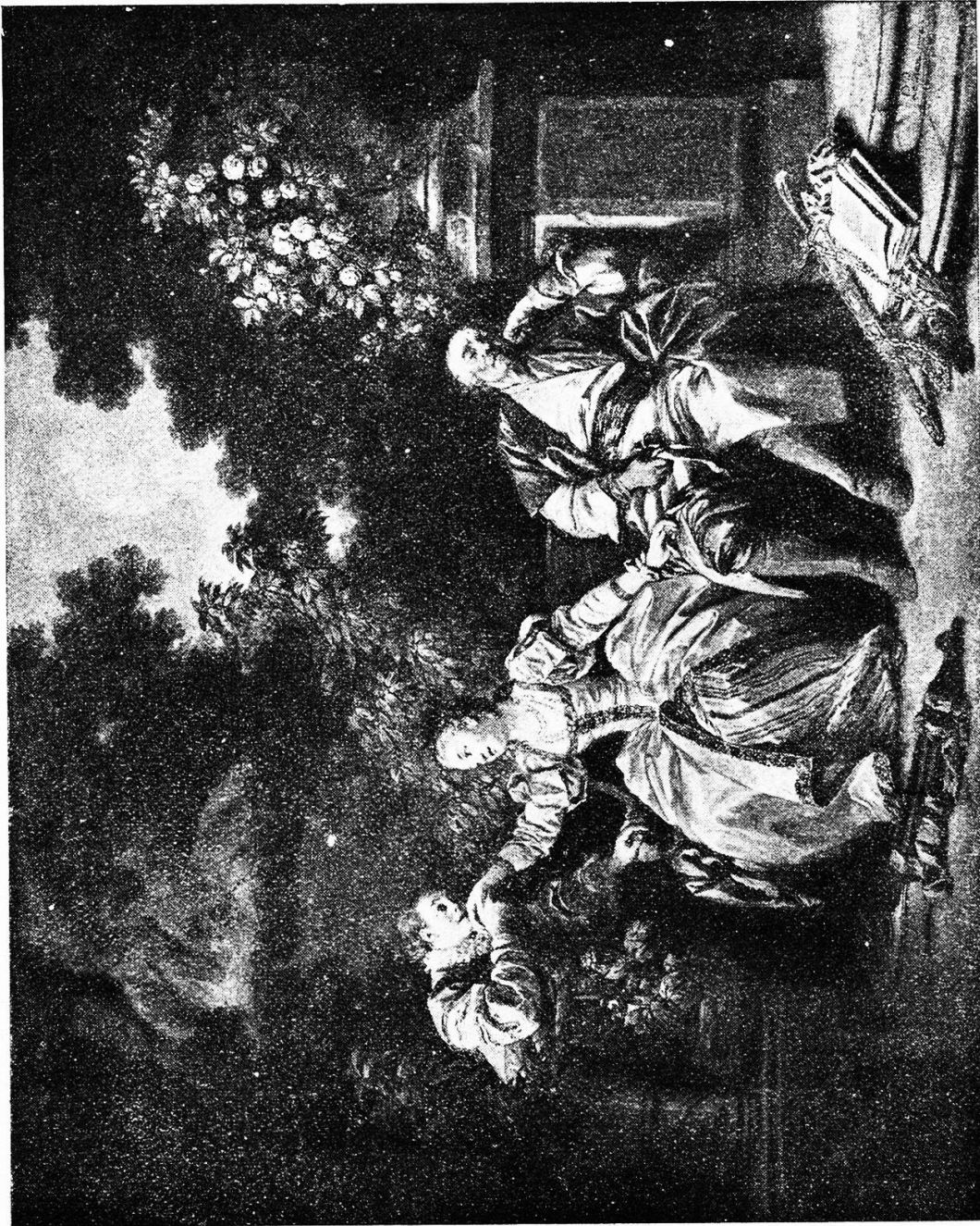
Jean Baptiste le Prince. Verbotene Liebchaft.

drücken. Die alte Pinakothek enthält kein Gemälde späterer Zeit. Was wir an Bildwerk brachten, entstammte ihr; weiteres muß der neuen und anderen Sammlungen entnommen werden.