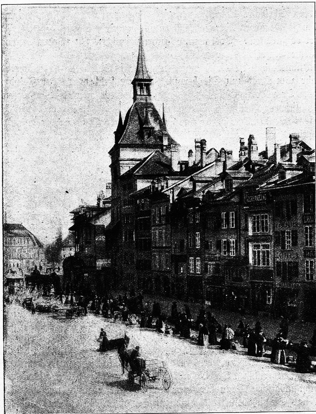
Der Markt in Bern.

Doch ein Vorbereitungsbeehl kommt die Schützenlinie entlang: „Der Zug links wird einen Sprung machen!“ Pünktlich geben Sie ihn weiter, und er erreicht Ihren Leutnant, der den Arm emporhebt zum Zeichen, daß er den Befehl erhalten. Sie aber schauen mit großem Interesse nach links.