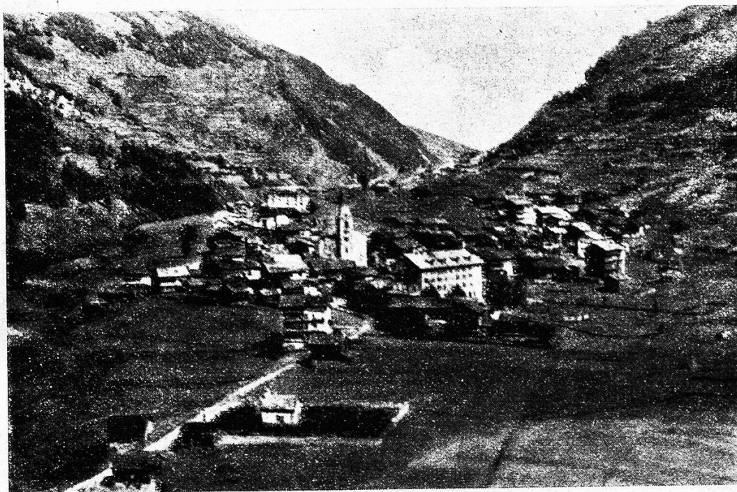
Ansicht von Evolena.

Was die andern Täler nicht bewahrt, im Gringertal ist's bis auf den heutigen Tag Sitte und Übung geblieben; sie tragen des Tales Tracht aus grobem, selbstgewobenem Tuch gefertigt, dem Stoff der Capuziner nicht unähnlich. — Ein Sonntag aber, da sie Männlein und Weiblein, Alt und Jung