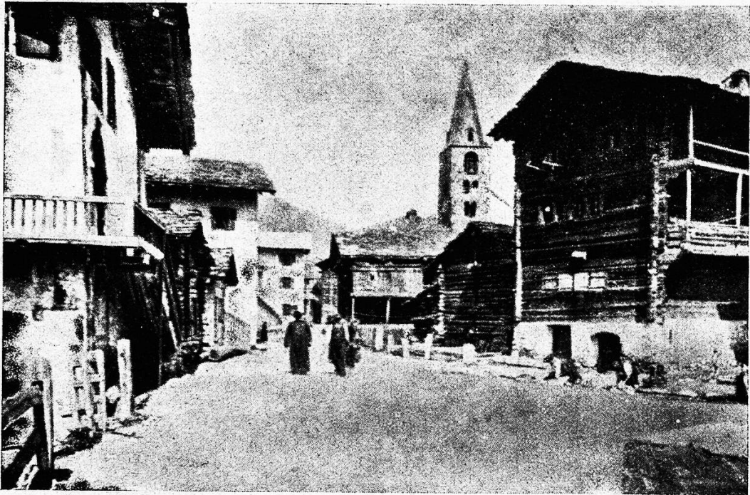
Eine Straße in Ebolena.

sah er hier? Im obersten Turmfenster — sie alle stehen nach den vier Windrichtungen hin weit offen — hing eine ansehnliche Glocke zur kleineren Hälfte zum Turme heraus, daneben aber dicht an der Glocke stand der „Läuter“, mit sehnigem Arm schwang er die Glocke am Hebel, schwang stark und stärker, bis er die Glocke buchstäblich auf den Kopf gestellt hatte, daß der aufrecht