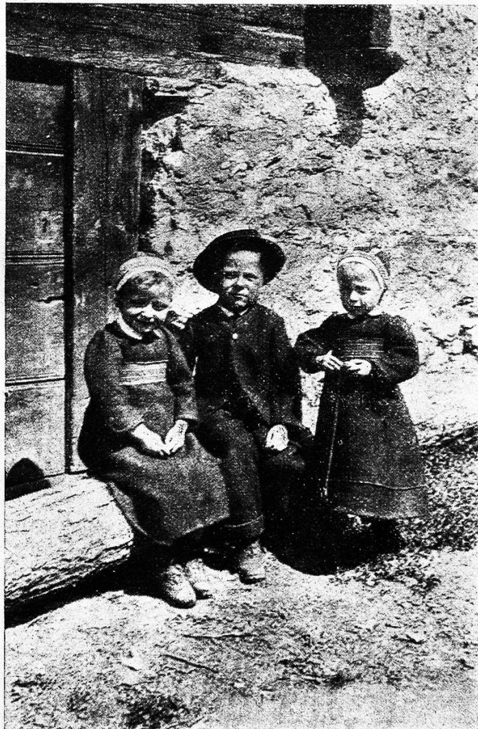
Kinder in Evolena.

Und die Kleinen, die Kinder! Die niedlichen Mädchen! Statt des Tellerhütchens umschließt das kleine feingestrickte Häubchen das volle Kinderantlitz, rote, frische, runde Backen und munter funkelnde Auglein! Wer dies Bild einmal gesehen, wird's nicht wieder vergessen. Und mehr als einem dieser Kleinen wäre in dem über allen Wechsel der Mode erhabenen Kleidchen auf jeder Puppenausstellung der erste Preis sicher gewesen. Man muß sie einmal in ihrem Sonntagsstaat gesehen haben, sauber und niedlich, die kleinen, reizenden Walliser Kinder, dann sind sie zum Verlieben. In der Kirche freilich war für die unruhigen Geisterchen die Predigt viel zu lang. Auf der Mutter Arm waren die einen sanft entschlafen, andere waren kaum mehr zu „bändigen“, sie kletterten hin und her auf der Mutter Schoß, steckten das niedliche Köpfchen über die Schulter zurück und sahen sich neugierig und verwundert den Fremdling an, bald wollten sie dies, bald jenes, nur vom Stillsitzen war keine Rede mehr, dort hielt das eine der Mutter Gebetbüchlein in den zierlichen Händchen, wieder ein anderes spielte mit dem Rosenkranz und sorgfältig glitten dessen Kügelchen durch die zarten Finger. Wieder eines wanderte von der Mutter Schoß auf den der Nachbarin. Sie waren redlich geplagt, die viel ge-