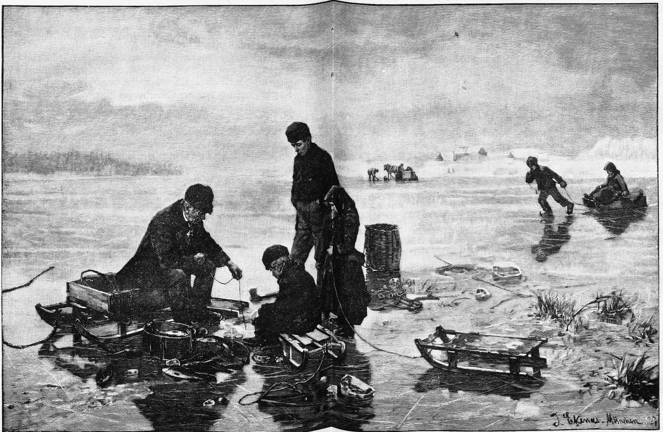
Fischfang unter dem Eise. Gemälde von J. Ekenaes.