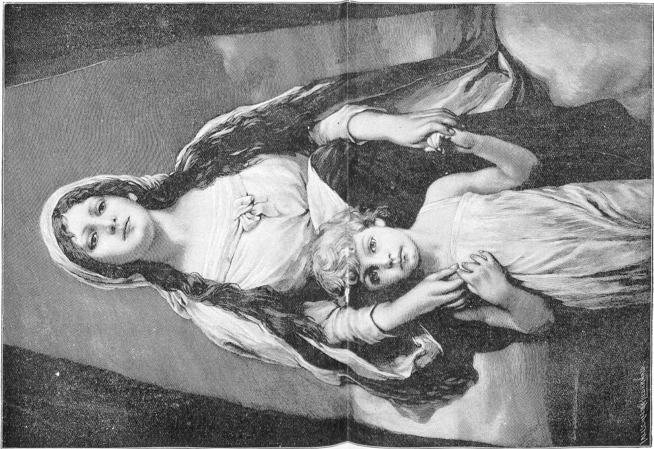
Zusicht und Liebe. Nach dem Gemälde von Gabriel Metz.