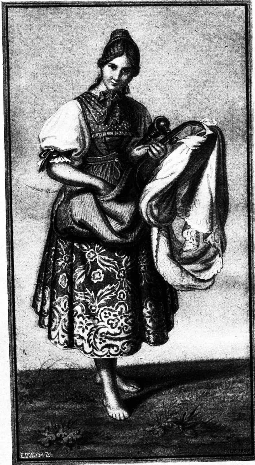
Appenzellerin aus Inneroden.

den waren, war die ungeschickte Leitung ihrer Offiziere Schuld. Die Mariahilfer Vorstadt wurde zuerst von der französischen Avantgarde besetzt. Die Österreicher zogen sich am Abend des 10. Mai bis auf den letzten Mann