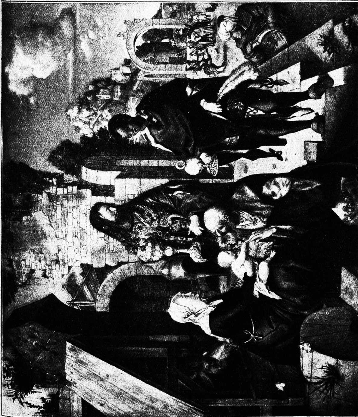
Die Anbetung der heiligen drei Könige von Albrecht Dürer.

Aus dem byzantinischen Vorstellungskreise, im Verein mit der Weissagung des 72. Psalms: „Die Könige zu Tharsis und in den Inseln werden Geschenke bringen; die Könige aus Reicharabien und Seba werden Gaben zuführen,“ mag zuletzt auch die Umwandlung der drei Magier in Könige hervorgegangen sein. In der schriftlichen Überlieferung findet sie