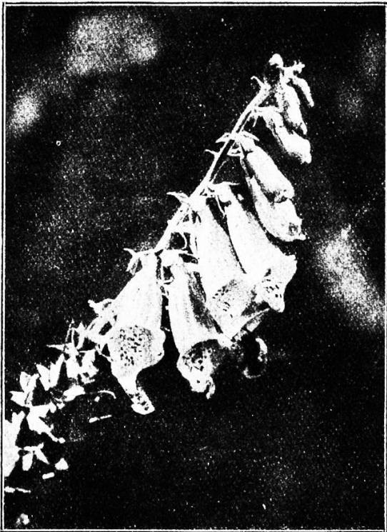
Roter Fingerhut mit einer durch die Blütenpracht angelockten Hummel.

Eine fröhliche Mädchenschar zieht schwatzend an mir vorbei. Sie haben heute einmal die Schulstube mit der lebendigen Natur vertauscht. Nicht ungern, das sieht man an ihren glücklichen Gesichtern und ihren hellen Augen, mit denen eine oder die andere in übersprühendem Glück auch mir, dem einsam am Wege Rastenden, einen freundlichen Gruß zu- nickt. Unwillkürlich folge ich der kleinen Gesellschaft mit den Blicken. Jetzt hat sich ihr wahlloses Geschwätz zu einem frischen Wanderlied zusammengefunden, das lustig durch den frischen Morgen schallt. Nun biegt