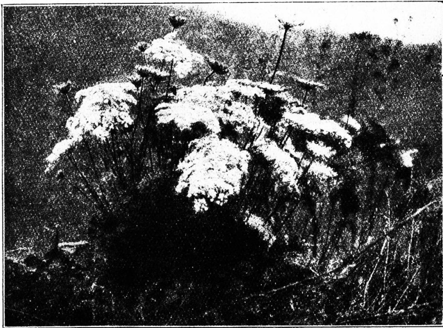
Blühende Möhre, die ihre Anziehungskraft durch Häufung der Blüten ausübt.

Ein Sinnesdefekt scheint allen Insekten eigen zu sein, sie sind kurzichtig. Sie vermögen also mittels der Augen die für sie passenden Blüten nicht aus größerer Entfernung wahrzunehmen. Was ihnen an Schärfe des Gesichtsinnes abgeht, das ersetzt ihnen reichlich ihr äußerst feines Geruchsorgan. Deshalb verlieh die Natur den Blüten den kostbaren Duft,