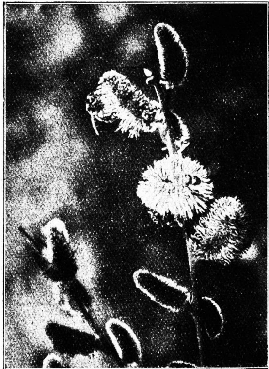
Weidenkätzchen — ein Tummelplatz für das losse Volk der Bienen.

ihr Weg in eine blumige Wiese. Da plötzlich verstummt der Gesang, die Reihen lösen sich, und, ehe ich recht begreife, warum, da hat sich schon die ganze Schar über die Wiese verteilt, und an dem hastigen Gehen und Bücken erkenne ich, was sie dorthin lockte: sie suchen Blumen. Scheinen sie nicht selbst leuchtende Blumen in ihren hellen Kleidchen, die sich in freudigen Farben von dem dunklen Wiesengrunde abheben? Nur noch wenige Jahre, und sie, die jetzt noch in der Knospenhülle stecken, werden zu den lieblichsten Menschenblumen erblüht sein. Dann werden sie ihren Schwestern auf der Wiese nicht nachstehen an Übermut und Liebreiz und werden sich schmücken für den Liebsten, daß er in ihnen das Schönste sehe, was die Welt für ihn bietet.