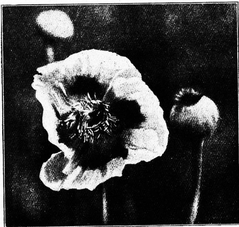
Bllühender Gartenmohn. Zwei Bienen wälzen sich im Blütenstaub des offenen Kelches.

So schwanken die bunten Flattervögel von einer Schönen zur anderen, nirgends ein langes Verweilen, ein kurzer Gruß, wohl auch ein in-