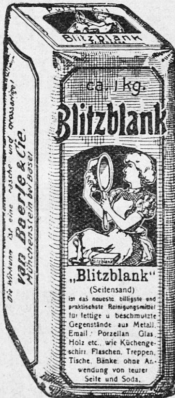
Die Abbildung zeigt ein Originalpaket „Blitzblank“