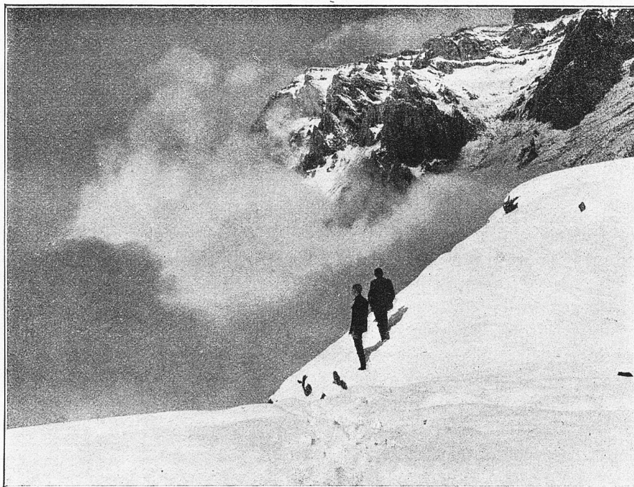
In der Umgebung der Fridolinshütte. Blick auf das Nebeltreiben, hinten der Selbsanft bei Linthal.