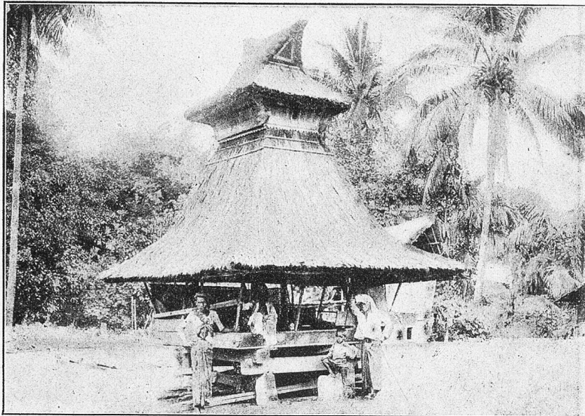
Haus der unverheirateten Jünglinge im Kampong Malam Lankat. Oben ist der Schädel des Vaters des Dorfhäuptlings aufbewahrt.

Bauernhauses annahm, lagen die Paddypeicher, die überdachten Kisten für die Reissvorräte.