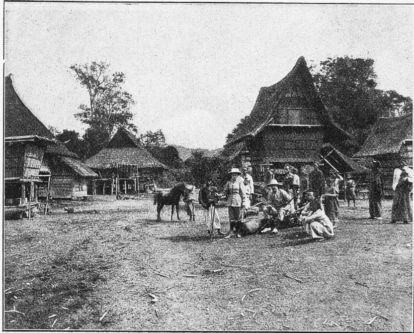
Ein Ausflug in ein Batakendorf auf der Karo-Hochfläche.

auch von Hunden erklettert werden kann, nicht unmittelbar ins Hausinnere gelangt. Das mächtige Dach besteht aus schwarzem Idschuk, einem zähen Geflecht, das der Morgatpalme als Blatthülle dient. Unter dem Hauptboden sind die Hühner- und Schweineställe angebracht, was bei Simujah bereits Ekel erregte.