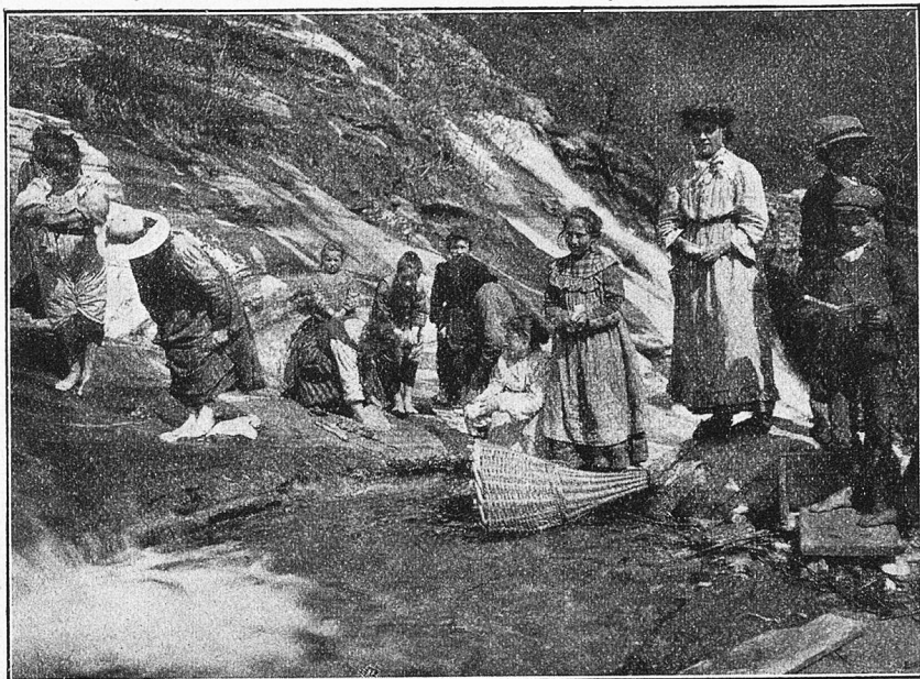
Das Waschen der Wäsche mit den Füßen (Eigentümlichkeit vom Onfernonetal).

Aber schon aus Eitelkeit sollten wir doch unferen Kindern diesen von uns ja nicht gewollten und doch so oft gewährten, aber leicht vermeidbaren Einblick in unsere innersten Angelegenheiten nicht gestatten. Denn es bleibe dahingestellt, ob die Erkenntnis, die im stillen das scharf beobachtende Kind über seine Eltern und Erzieher davonträgt, gerade immer schmeichelhafter Art ist. Es ist kein Wunder, wenn die Auto-