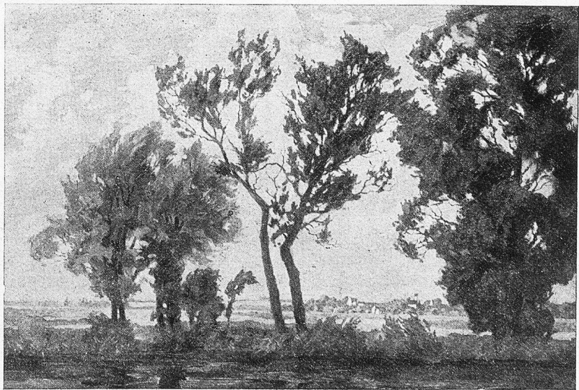
Abend an der Amper.

Daniel Webster zum Beispiel, der gefeierte amerikanische Staatsmann, legte in der Jugend keinerlei auszeichnende Begabung an den Tag. Als er noch nicht lange in eine höhere Schule seiner Heimat eingetreten war, traf ihn ein Nachbar auf dem Heimweg von der Schule weinend an und fragte ihn nach dem Grunde. Daniel sagte, er habe keine Hoffnung, jemals ein guter Schüler zu werden, er werde von den andern Jungen ausgelacht, weil er immer bei den Letzten sei, und habe sich jetzt vorgenommen, die Schule aufzugeben und ins Elternhaus zurückzukehren. Der gute Mann drang in ihn, wieder zur Schule zu gehen, nochmals einen Versuch zu machen und zu sehen, was saurer Fleiß vermöge. Webster ging hin, warf sich auf die Schularbeit mit der Entschlossenheit, sich durchzusetzen, und gar bald hatte er die Spötter von ehemals zum Schweigen gebracht, indem er an die Spitze der Klasse aufstieg und sich dort auch hielt.